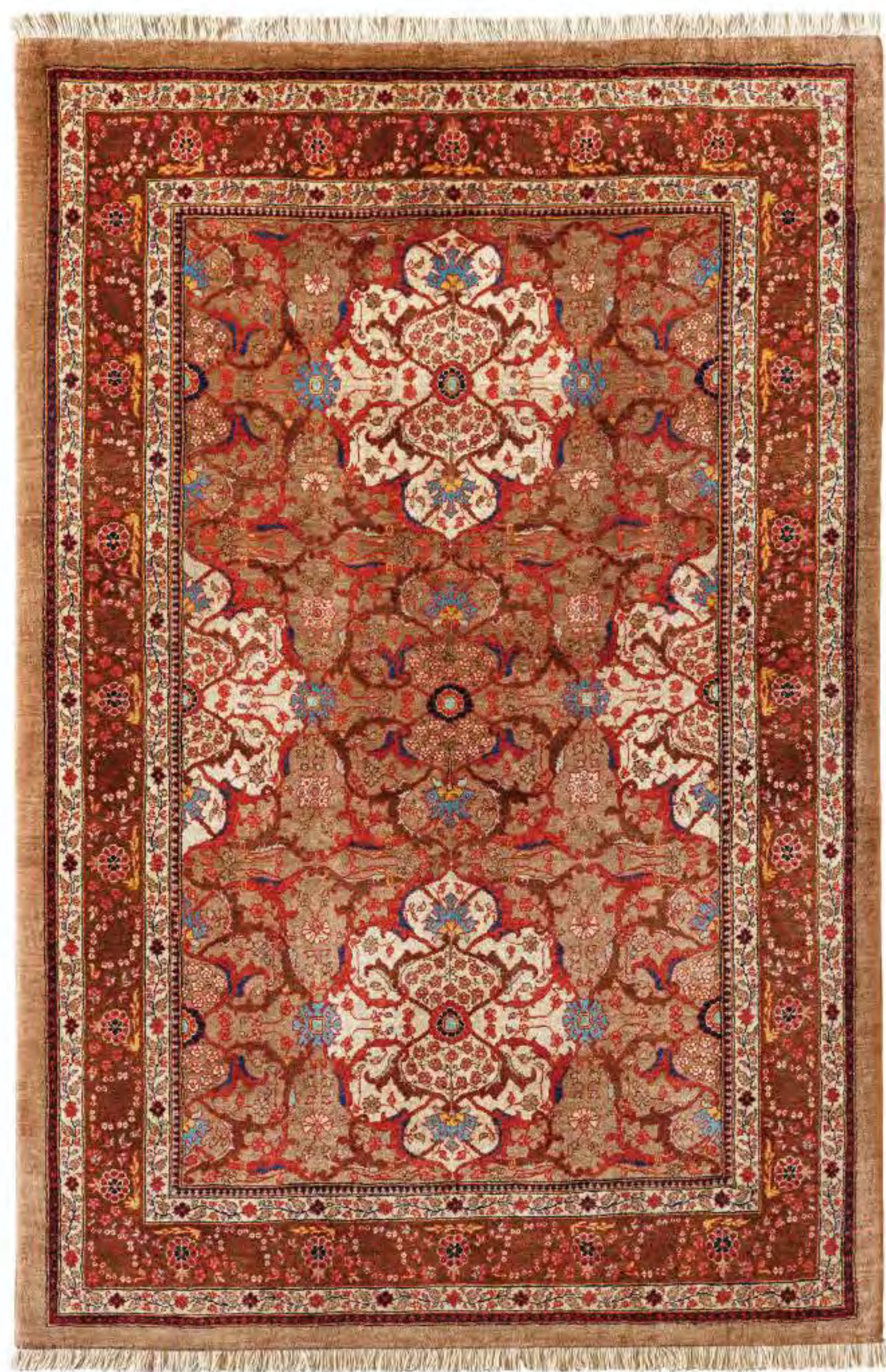
Left Raha 205x140cm Bidjar Wool