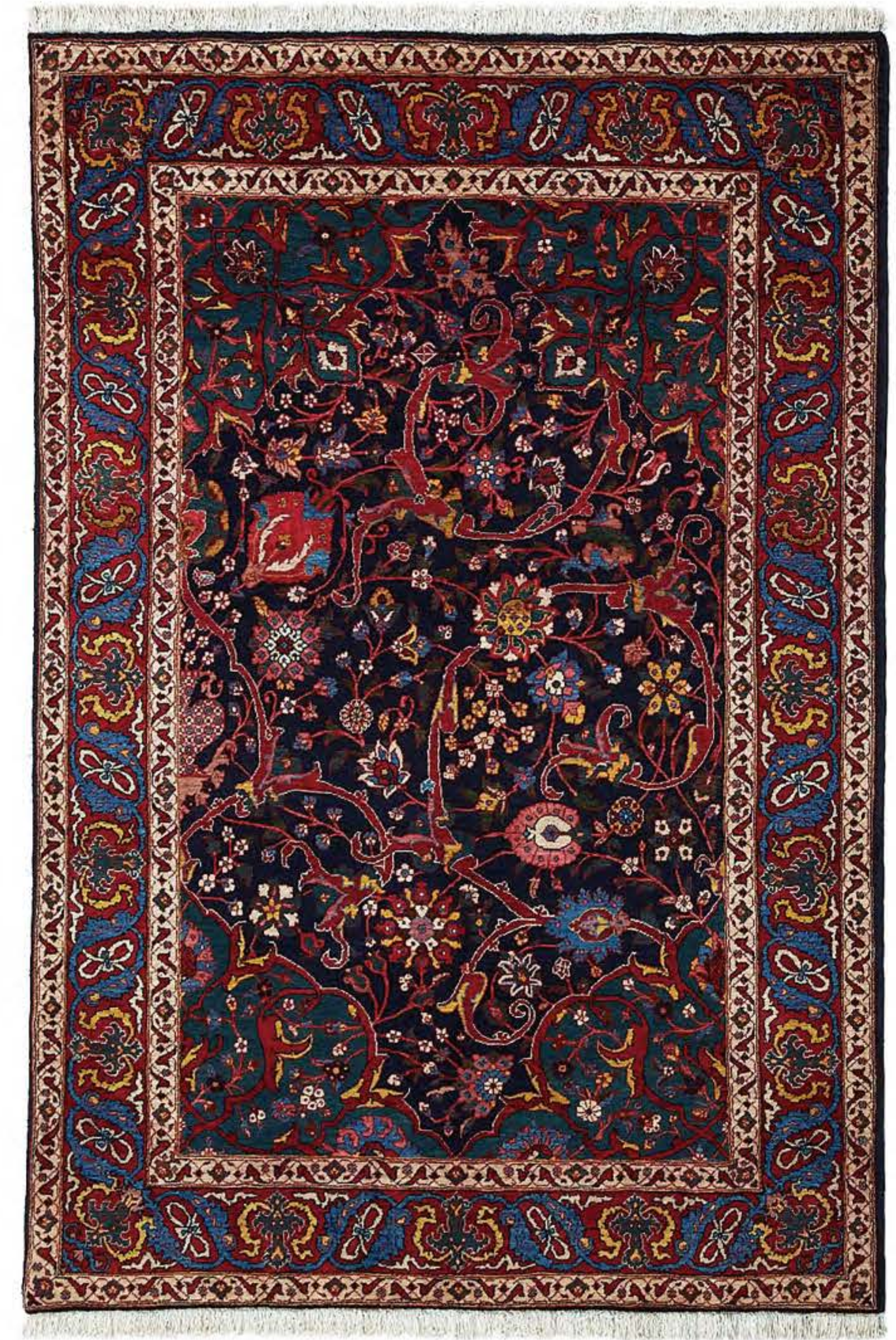
Right Shadi 220x155cm Bidjar Wool