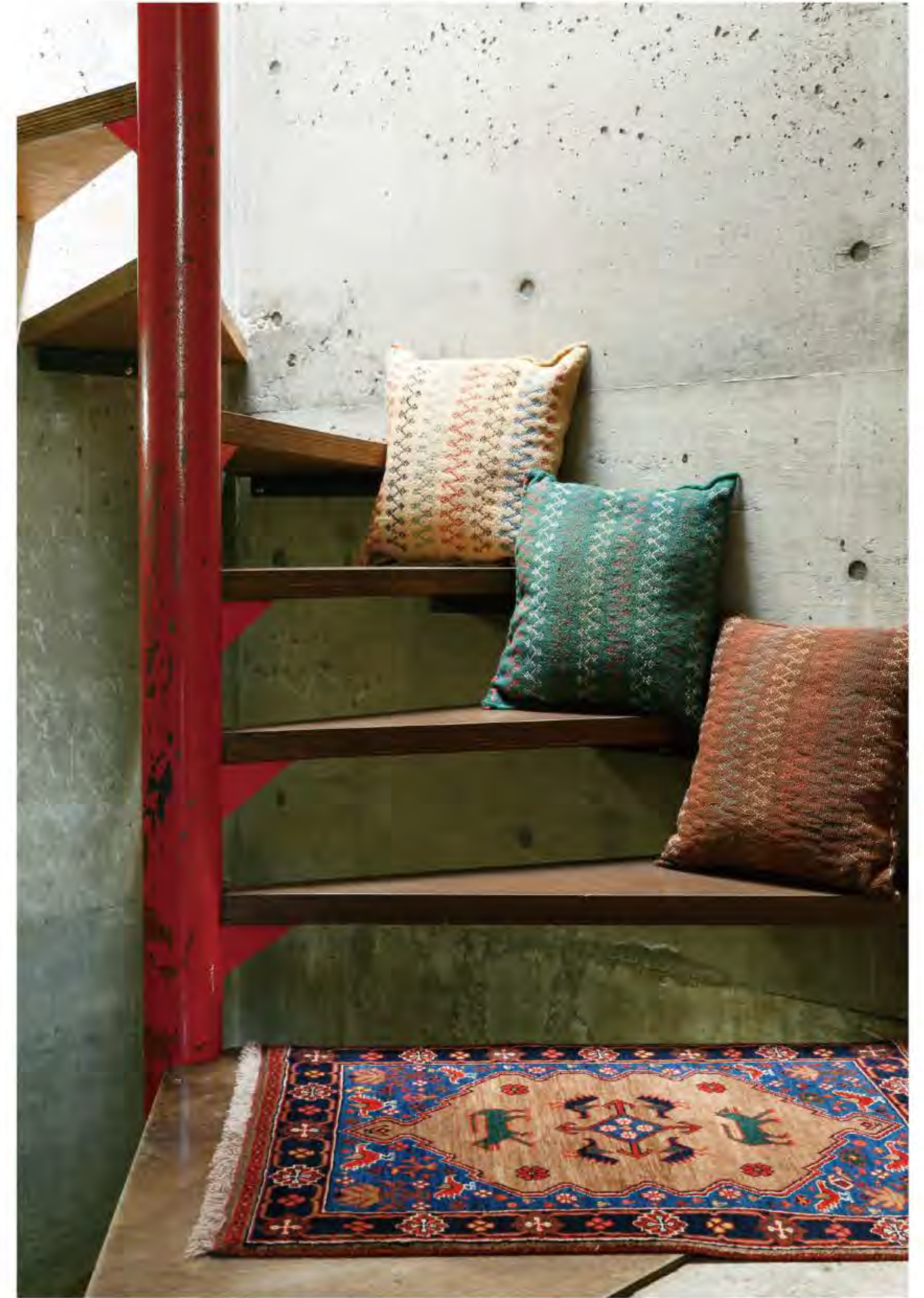
a. Golara 55x75cm Farahan Wool