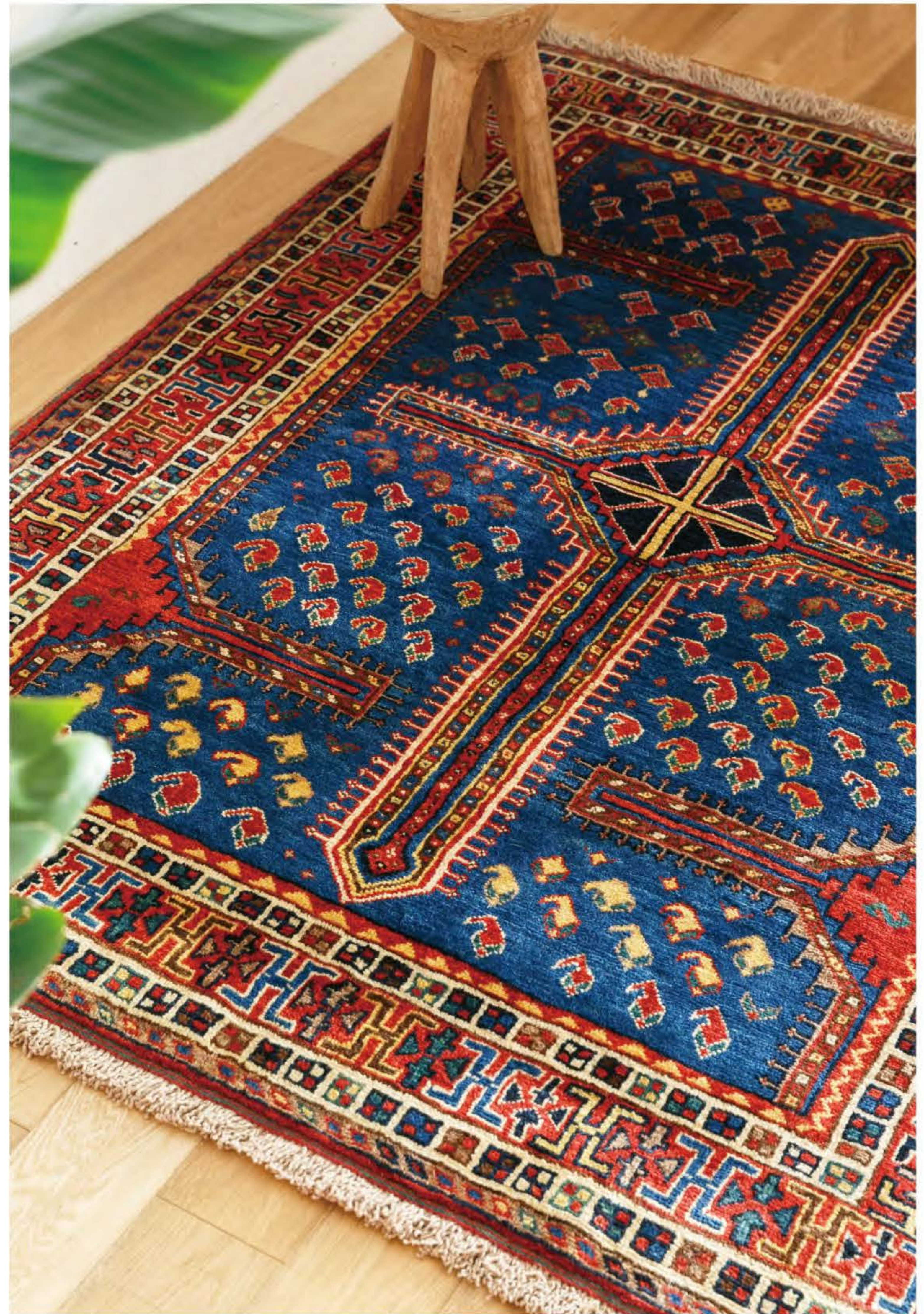
Left a. Shademoun 175×120cm Qashqahi Wool b. Pegah 135×100cm Qashqahi Wool c. Golbaf 180×105cm Qashqahi Wool