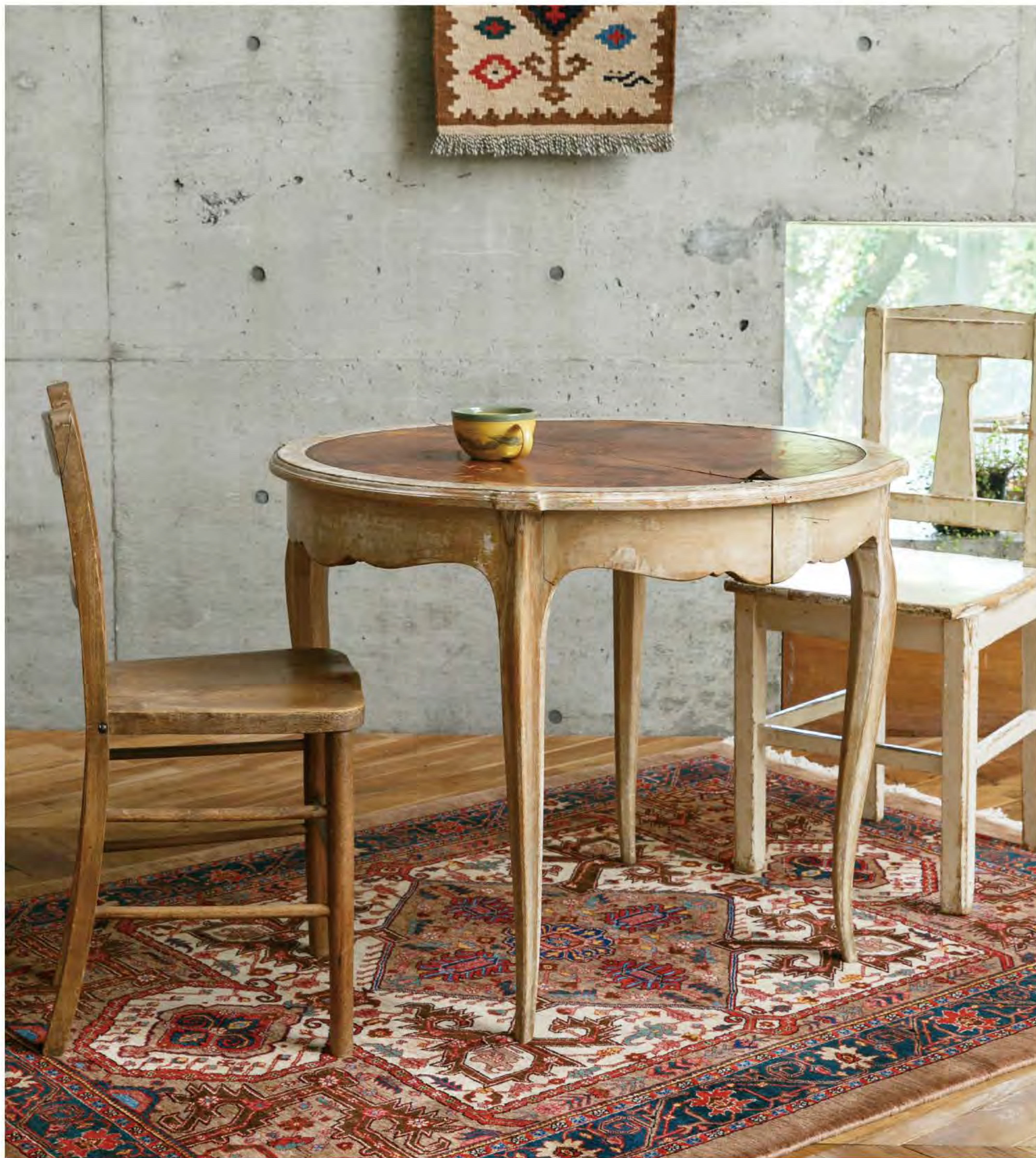
Right Sharareh 200x145cm Heriz Wool