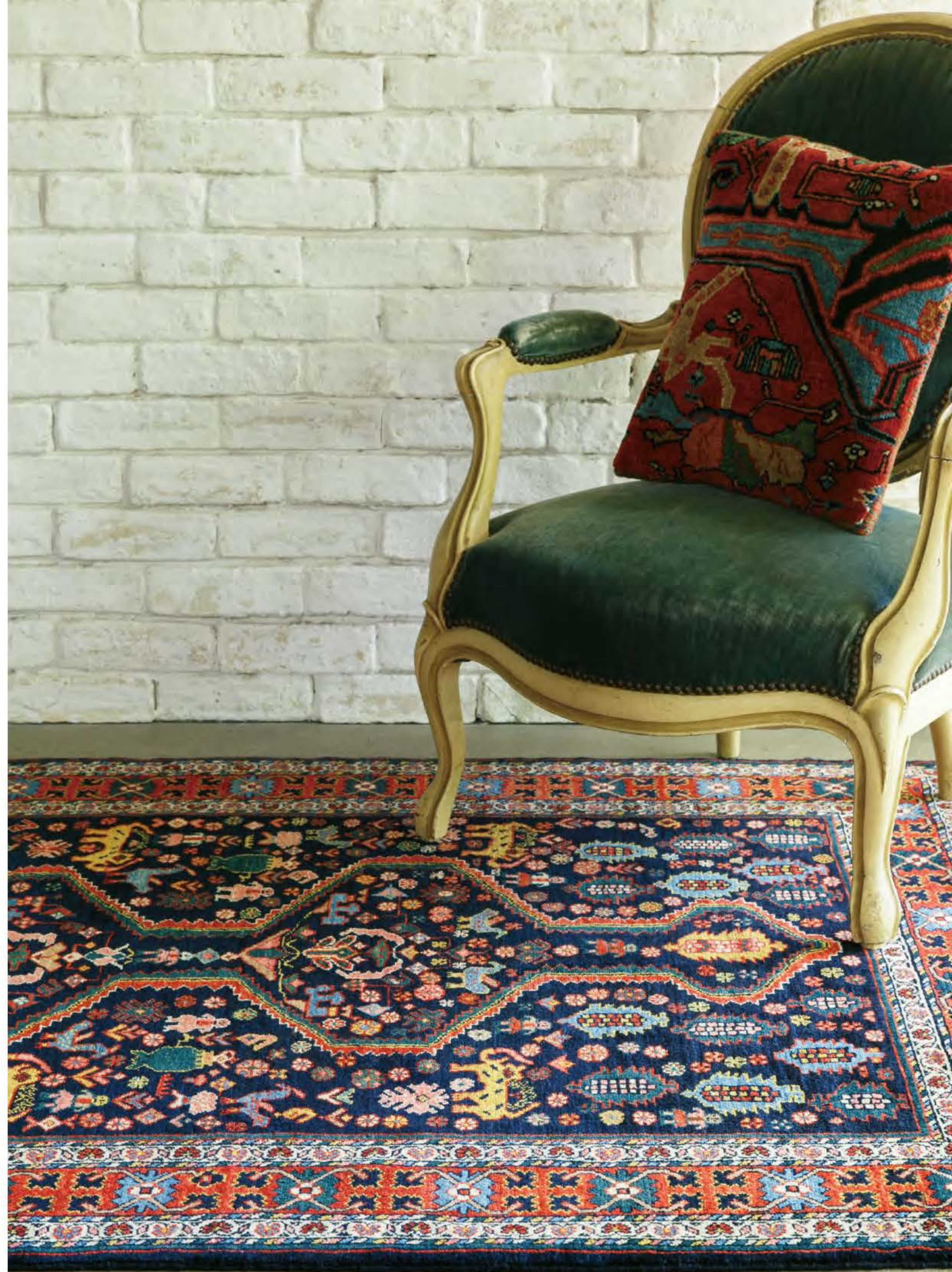
Right Samavar 160×125cm Malayer Wool