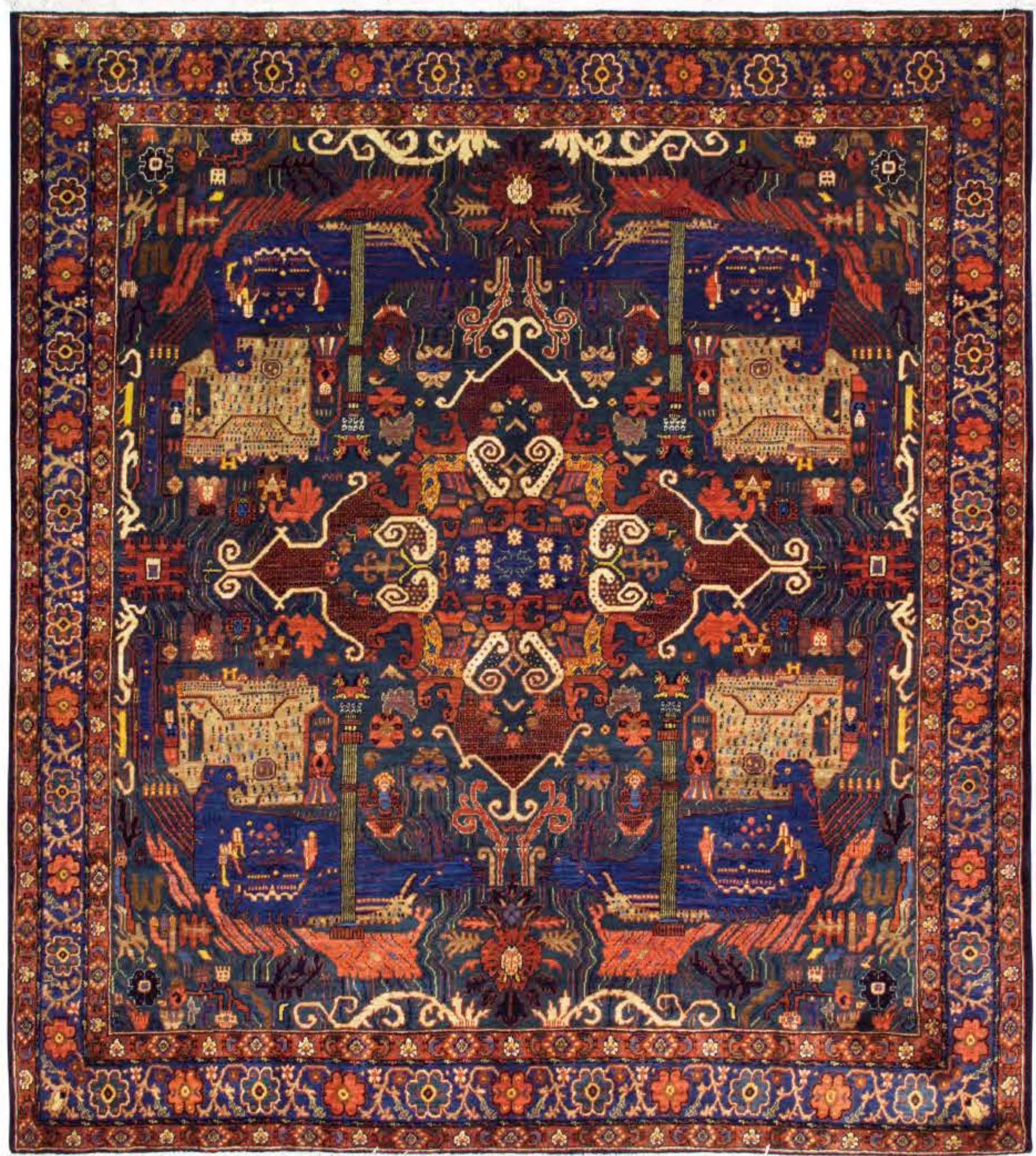
Left Mitra 240×210cm Malayer Wool