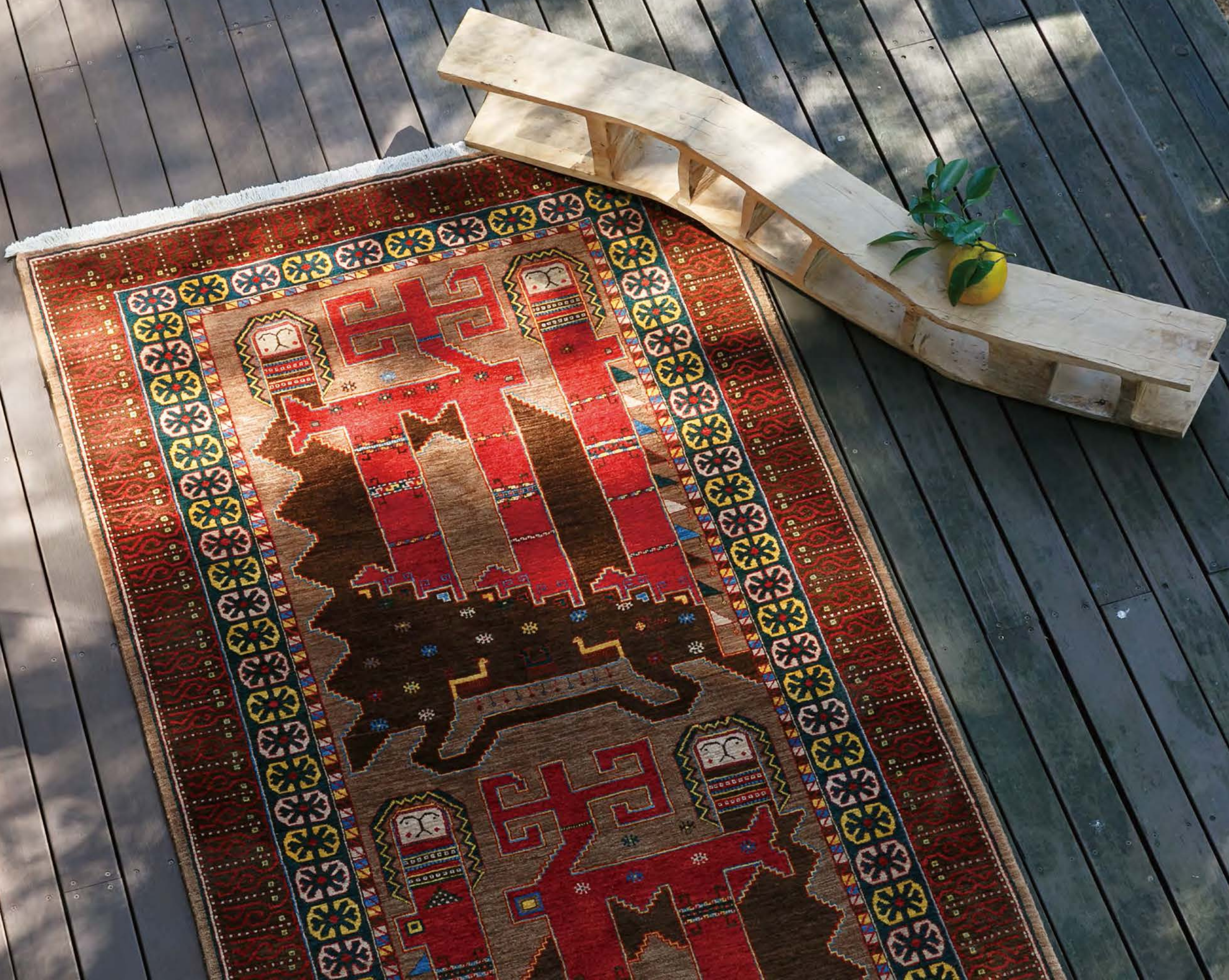
Iranvich 235x125cm Garrous Wool