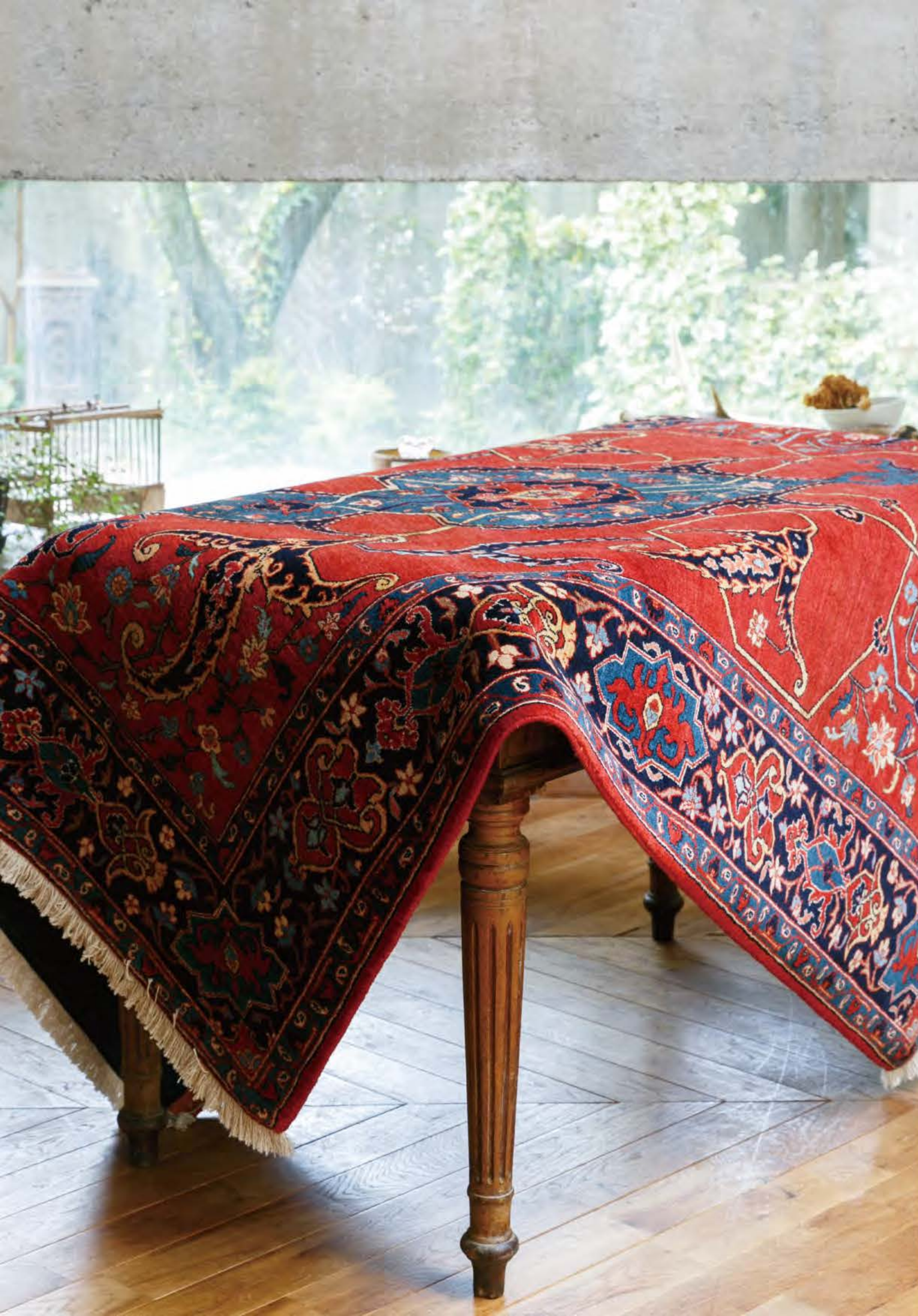
Left Khanom 175x140cm Bidjar Wool