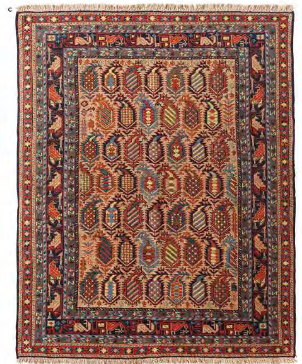
Left Sevim 245x190cm Shahsavan Wool, Sumak