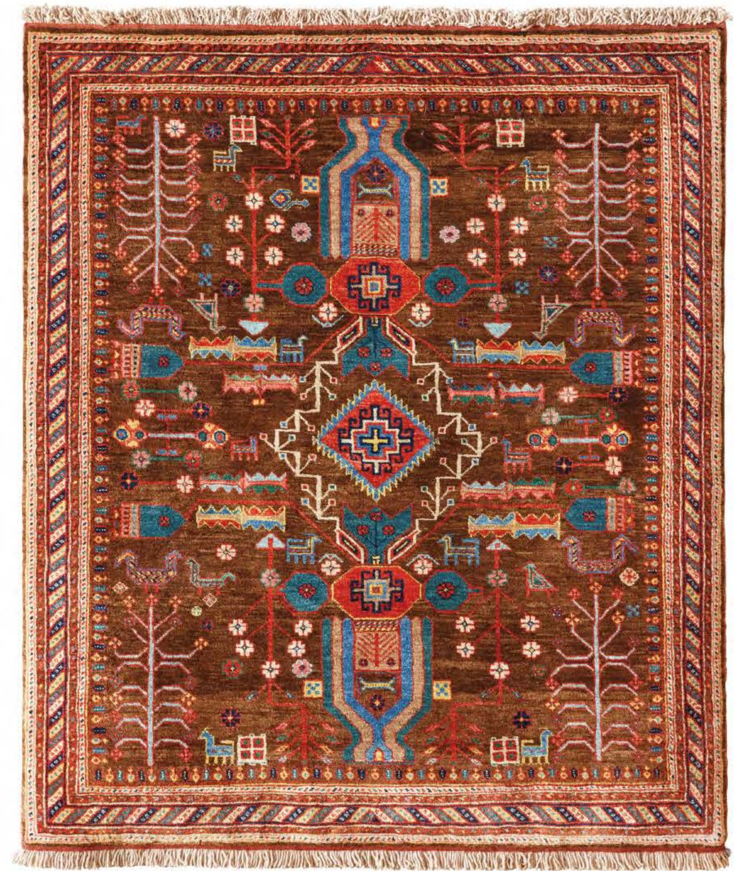
Left Mehrpo 240x185cm Qashqai Wool