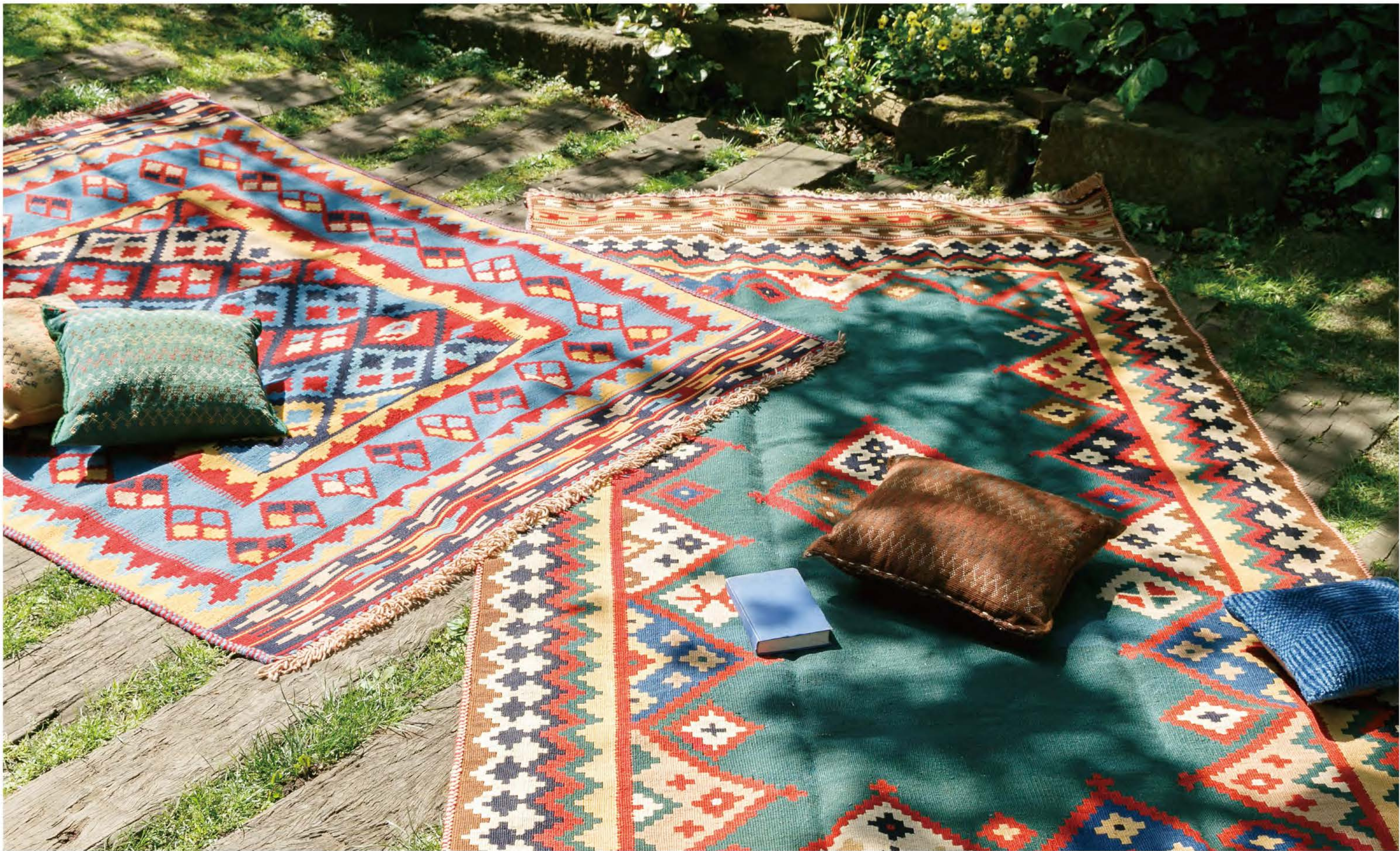
Left KQ48 205x160cm Qashqai Wool, Kilim