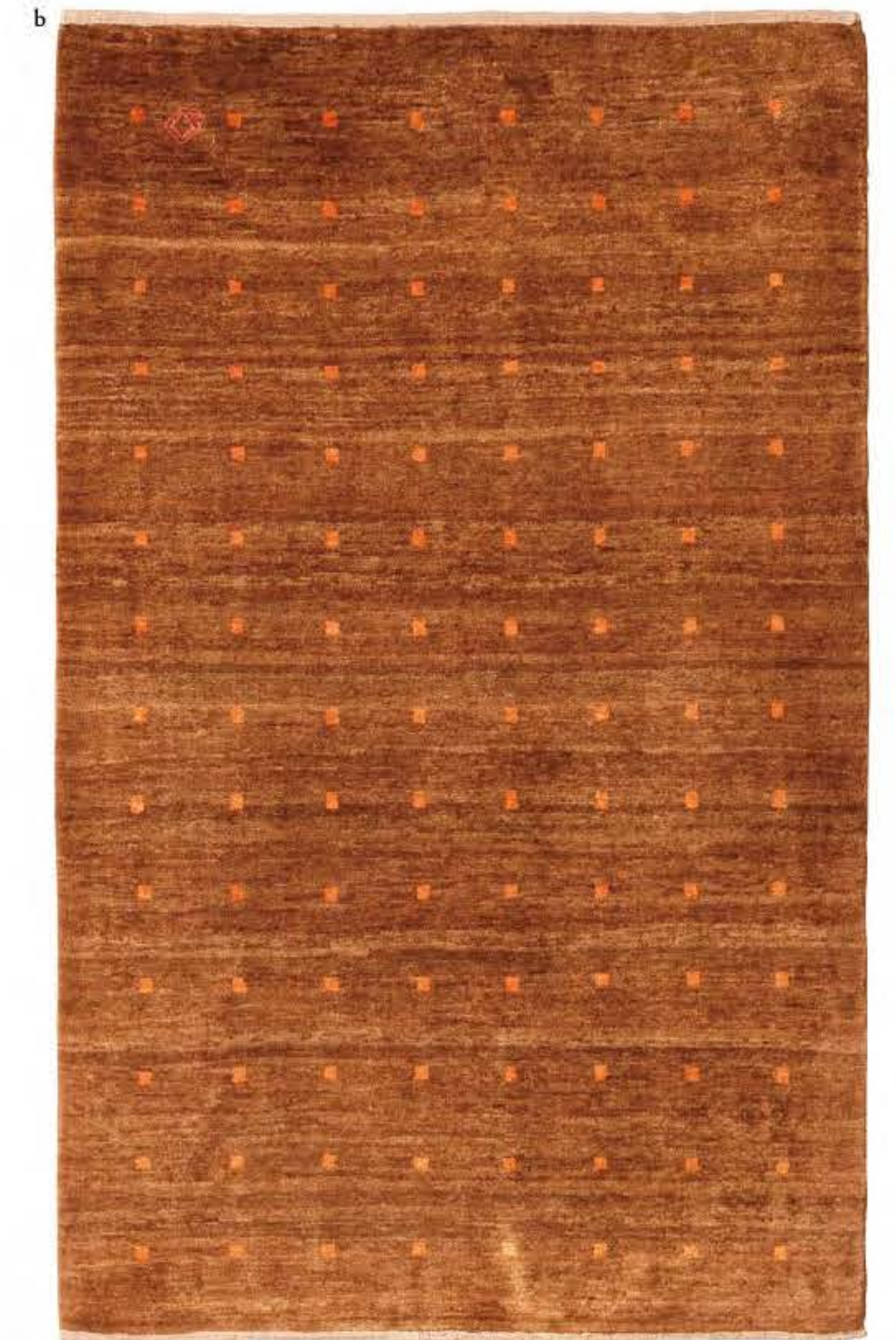
Left Emrooz 190×145cm Qashqai Wool