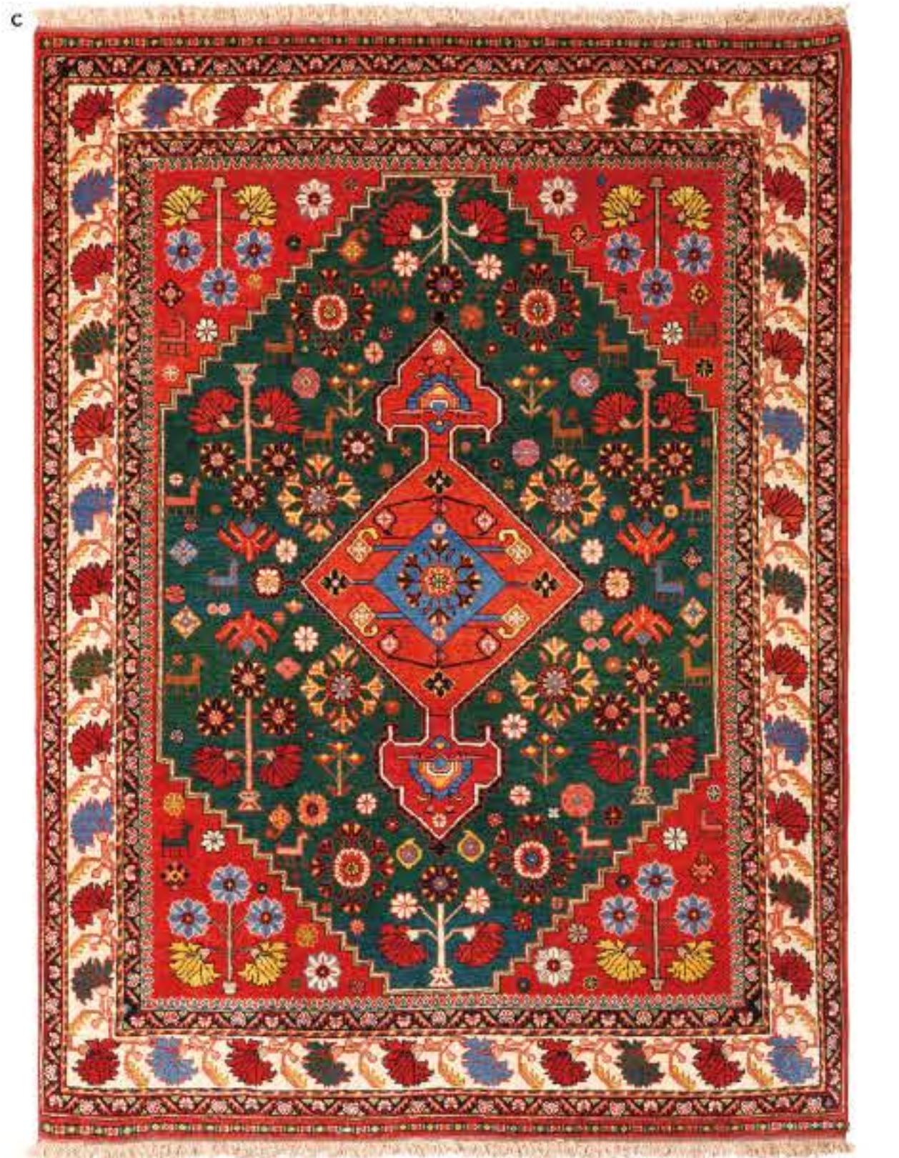
Left Salam 215x150cm Neiriz Wool