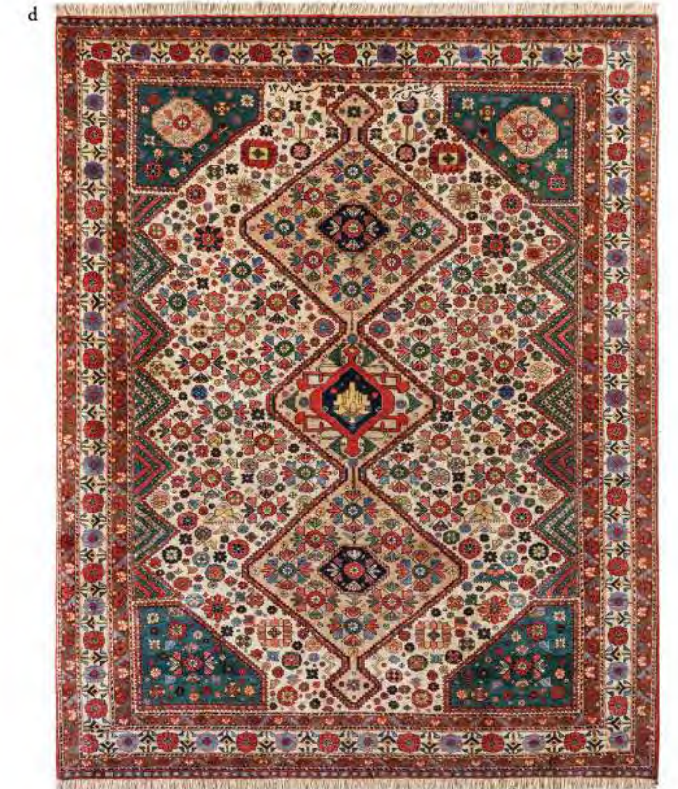
Left Azaddokht 320×210cm Bidjar Wool