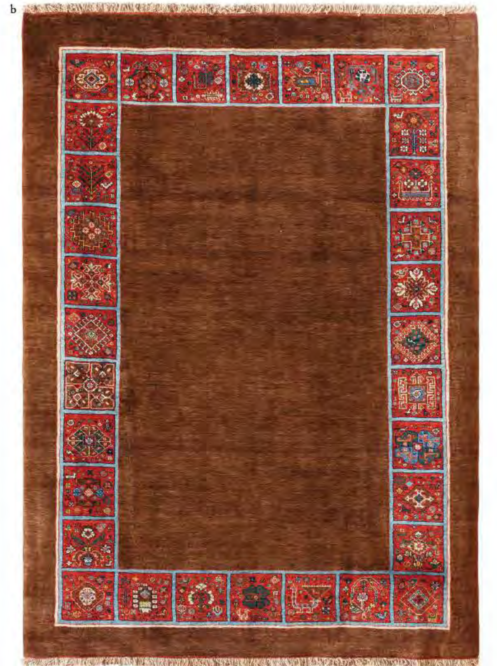
Left Parinaz 220×180cm Qashqai Wool