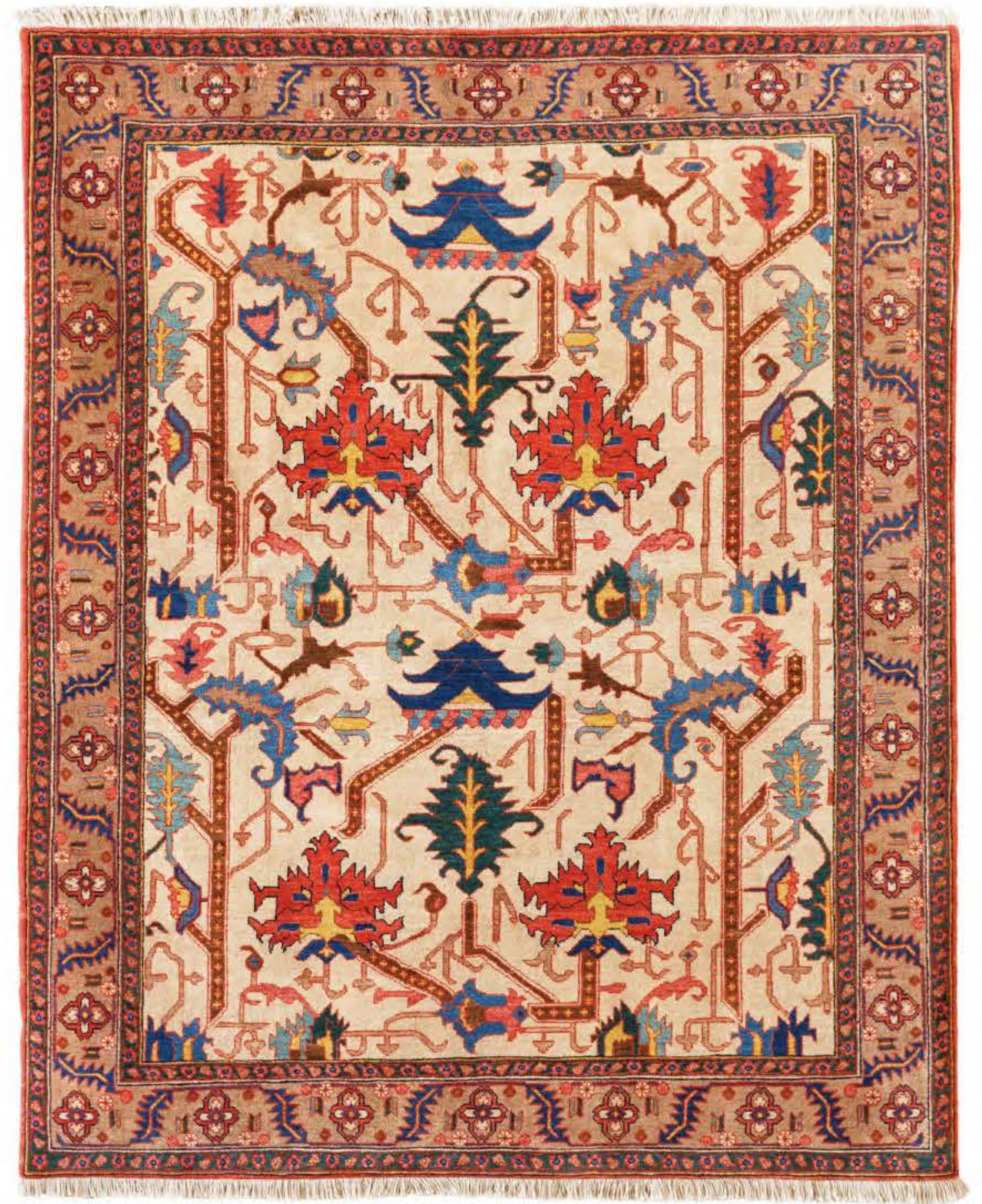
Left Yalda 230x170cm Heriz Wool