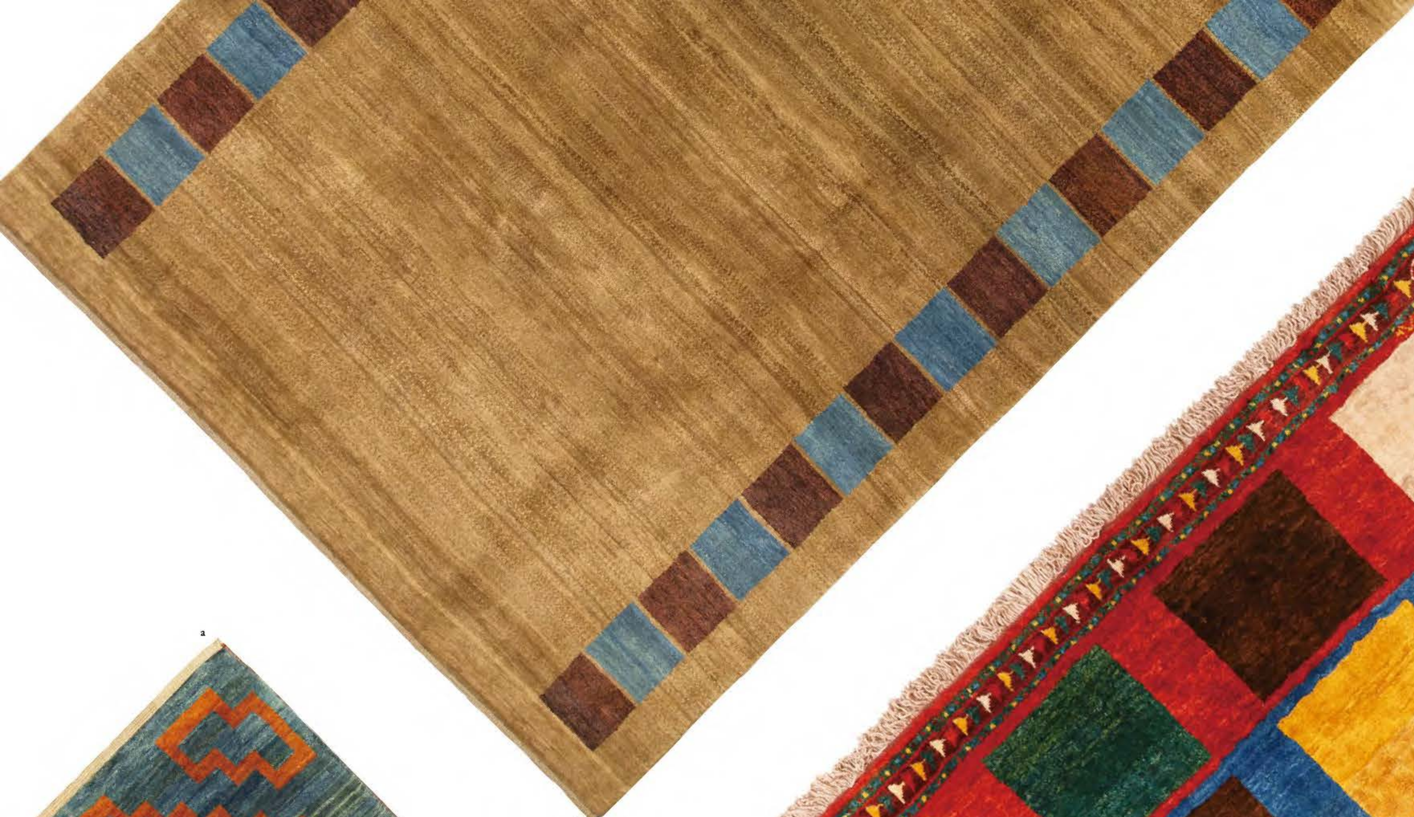
a. Parak 170×105cm Qashqai Wool