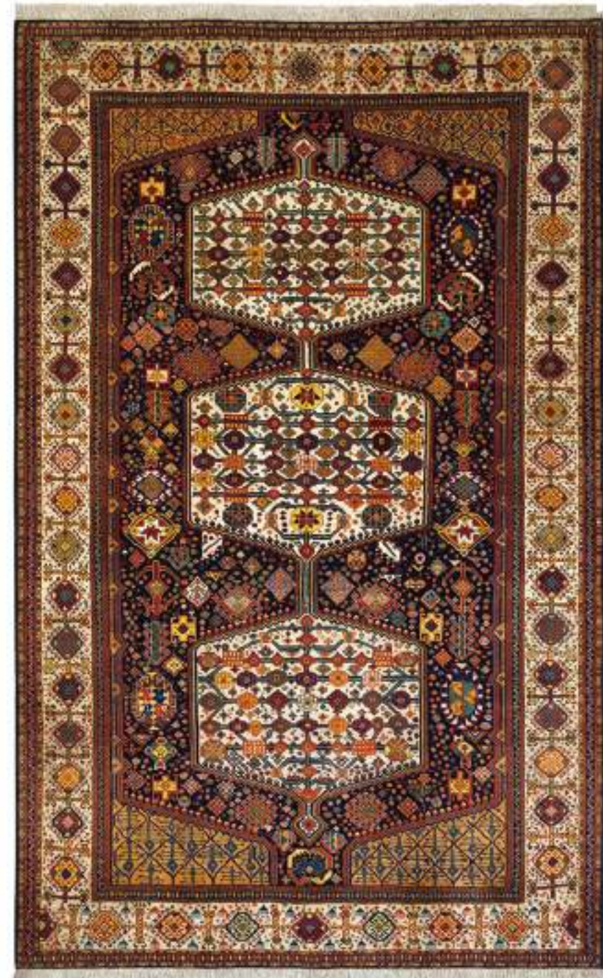
Azadi (自由女) 278x179cm Qashqai Wool