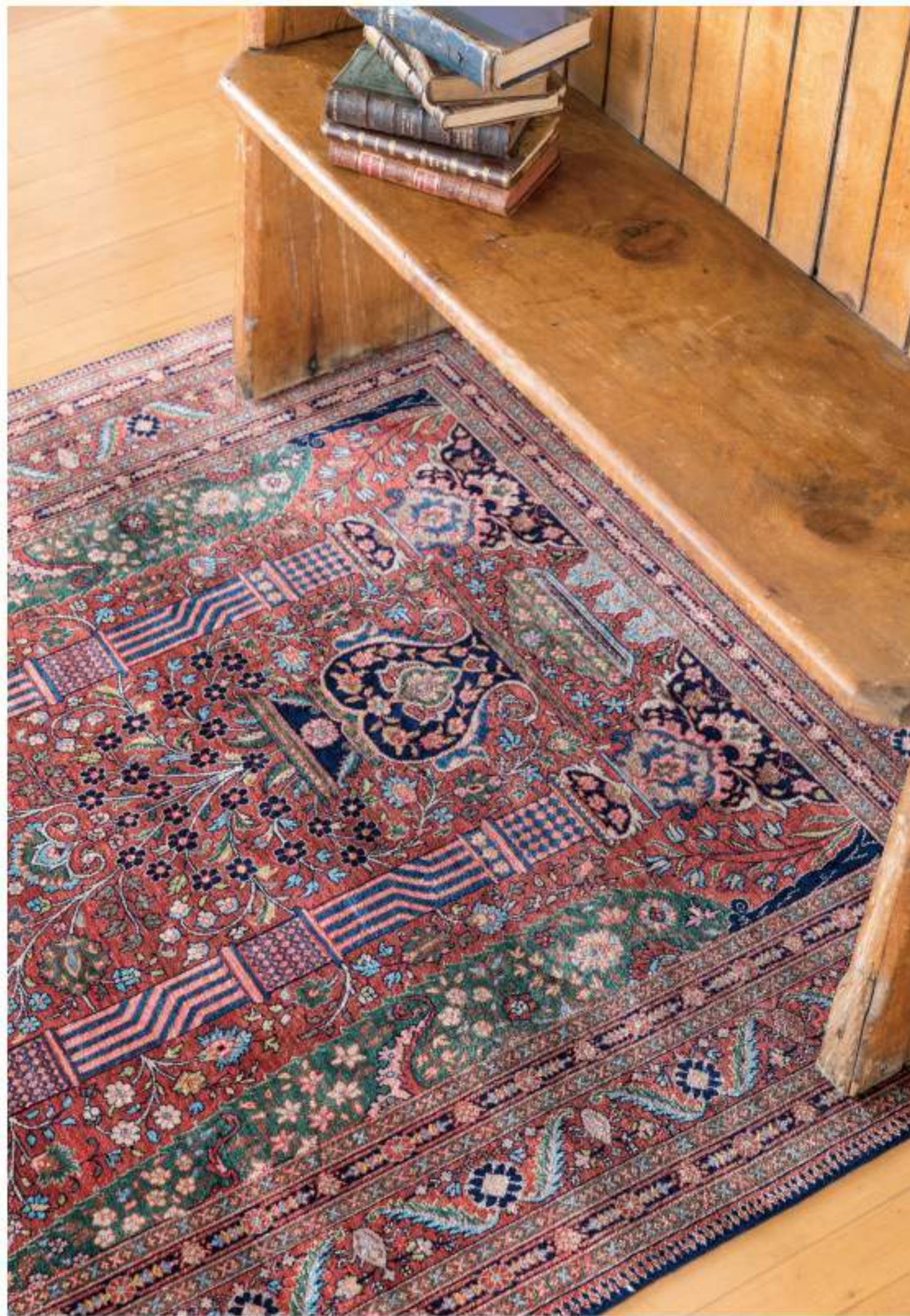
Right Jalil (高貴女) 160x125cm Tabriz Silk