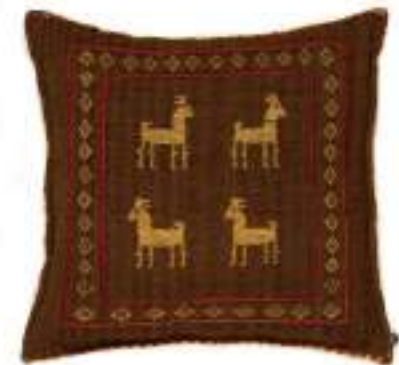
Left Setaleha (蓝) 205x150cm Shahsavvan Wool, Sumak