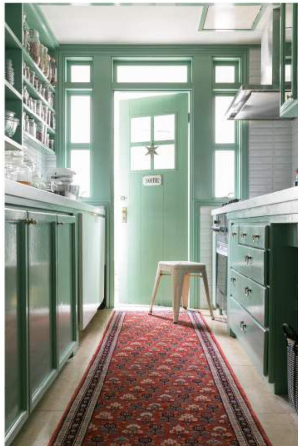
Left Shadish (明るい子) 323×216cm Garrous Wool