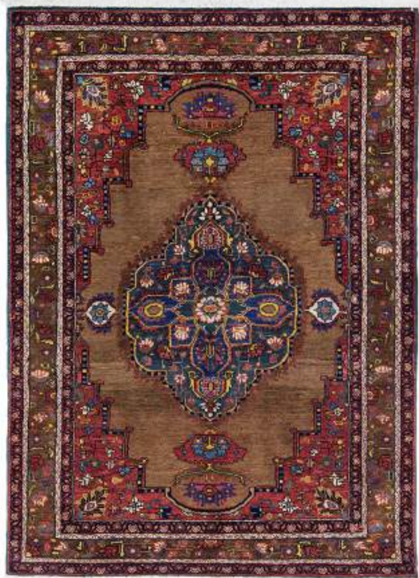
Left Golbanou (花のような女性) 146x106cm Farahan Wool