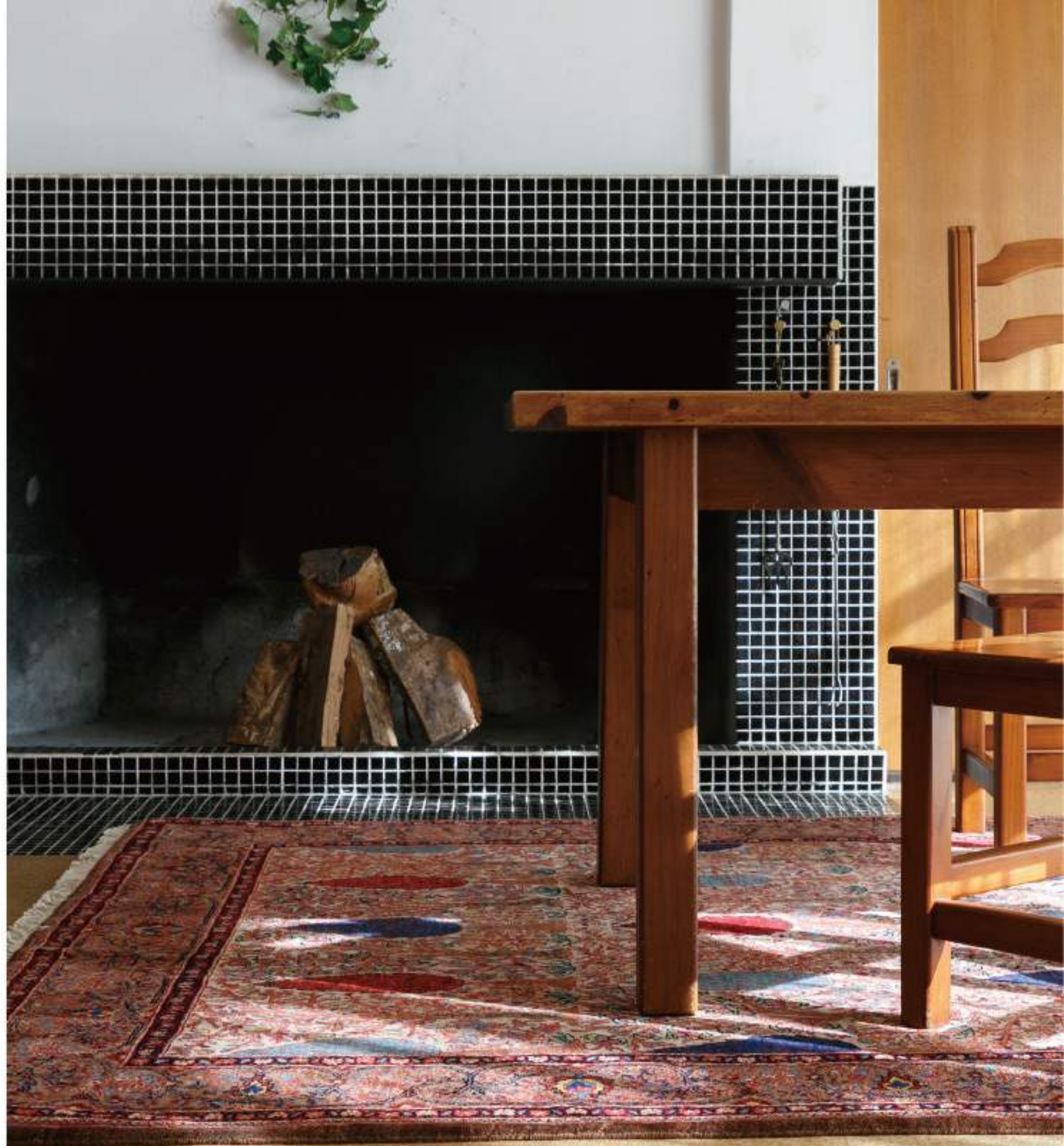
Right Ghalamstan (植樹林) 227x177cm Farahan Wool