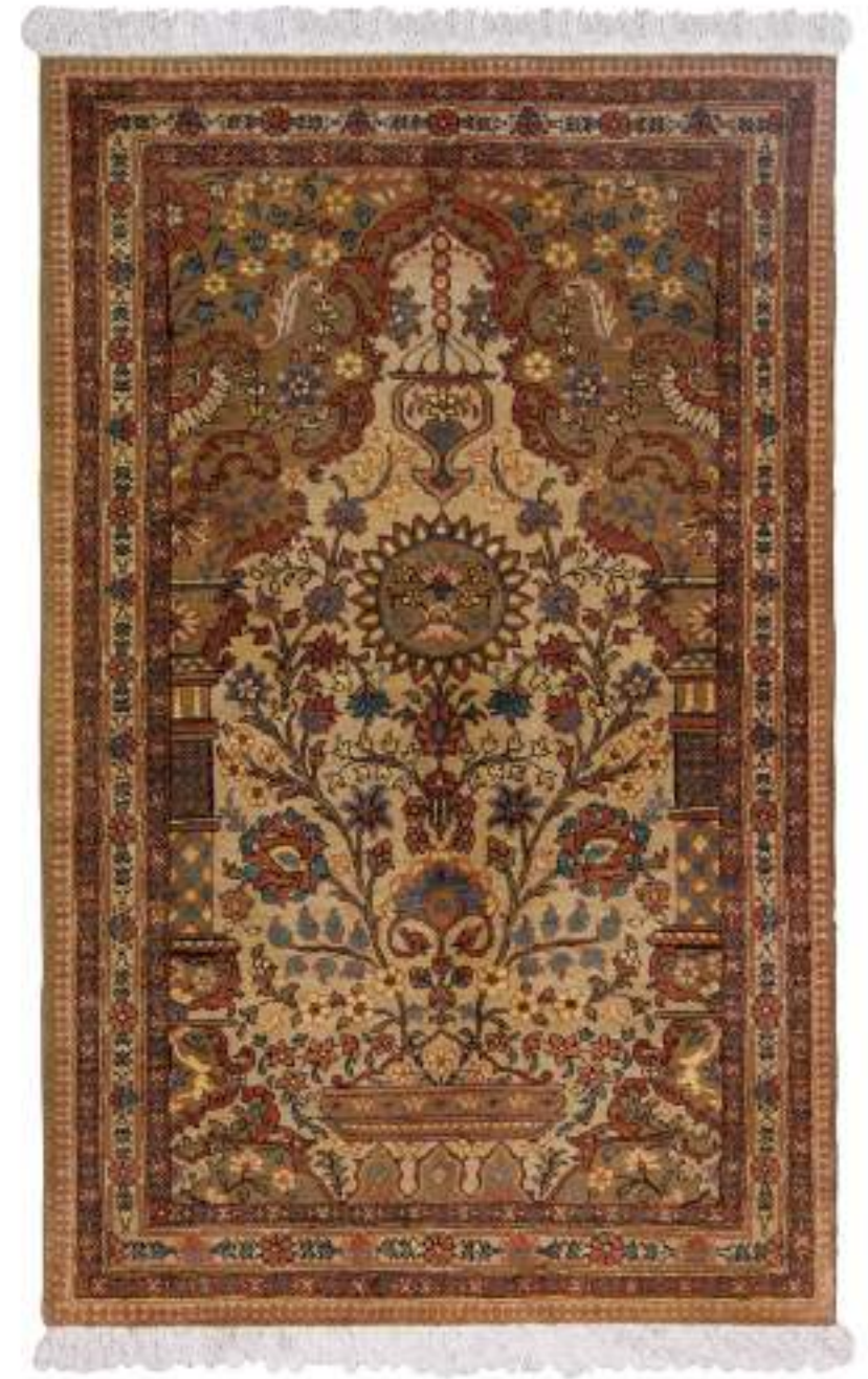
Left Atil (真正の) 160x105cm Bafjar Wool