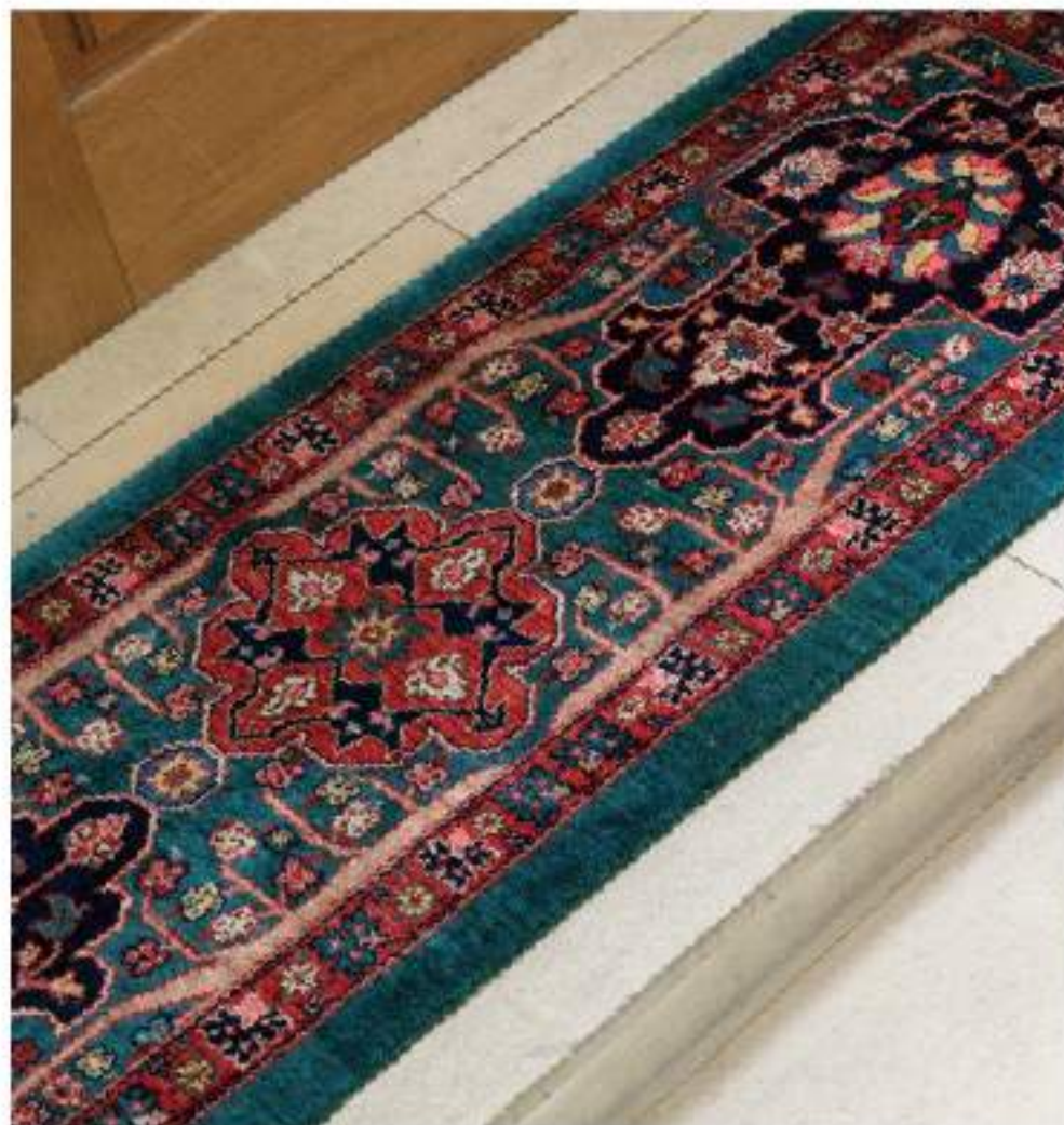
Gandomzal (ガンドマル) 145×48cm Bidjar Wool