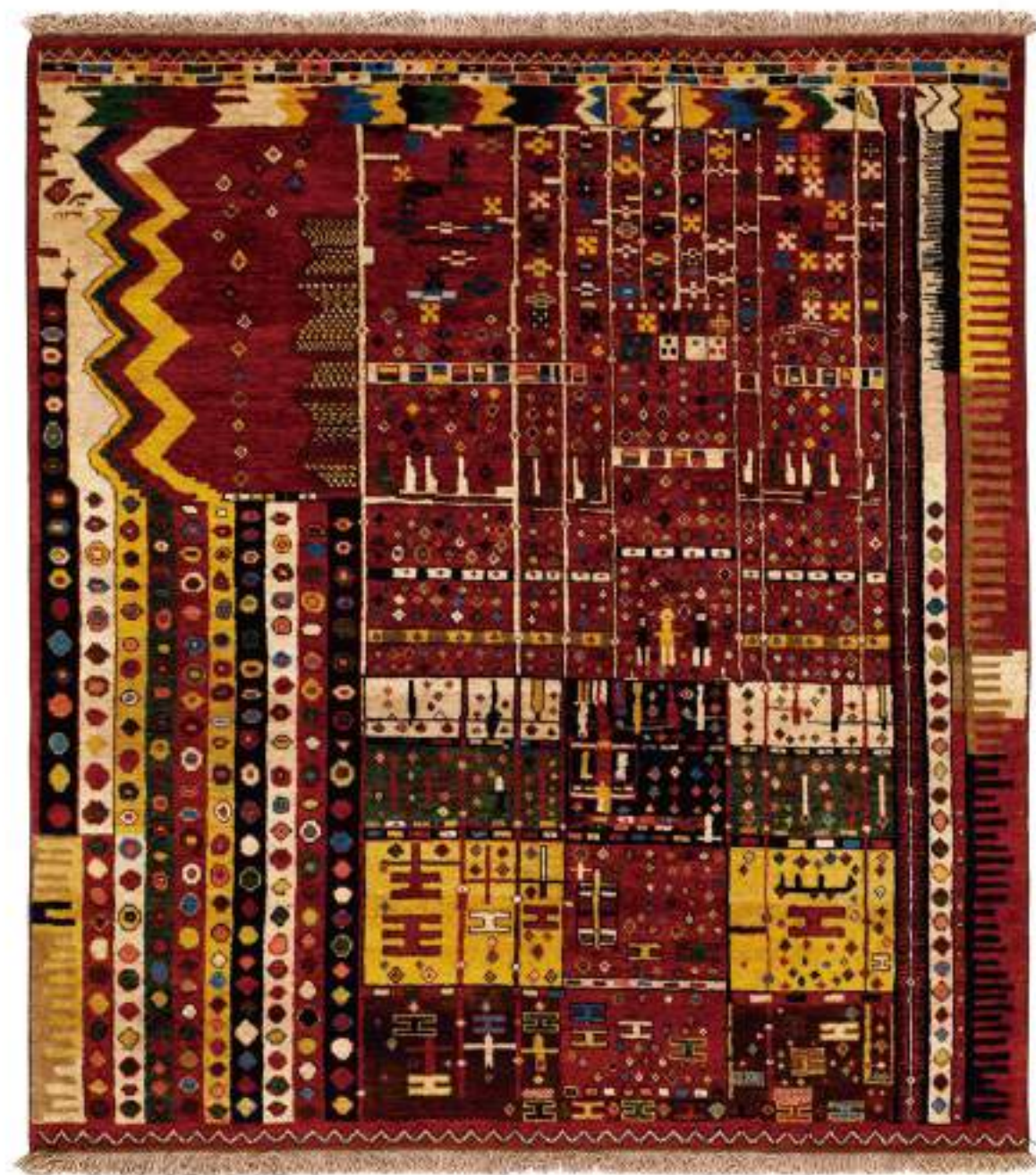
Left Javidan (水遣の) 165×177cm Qashqai Wool