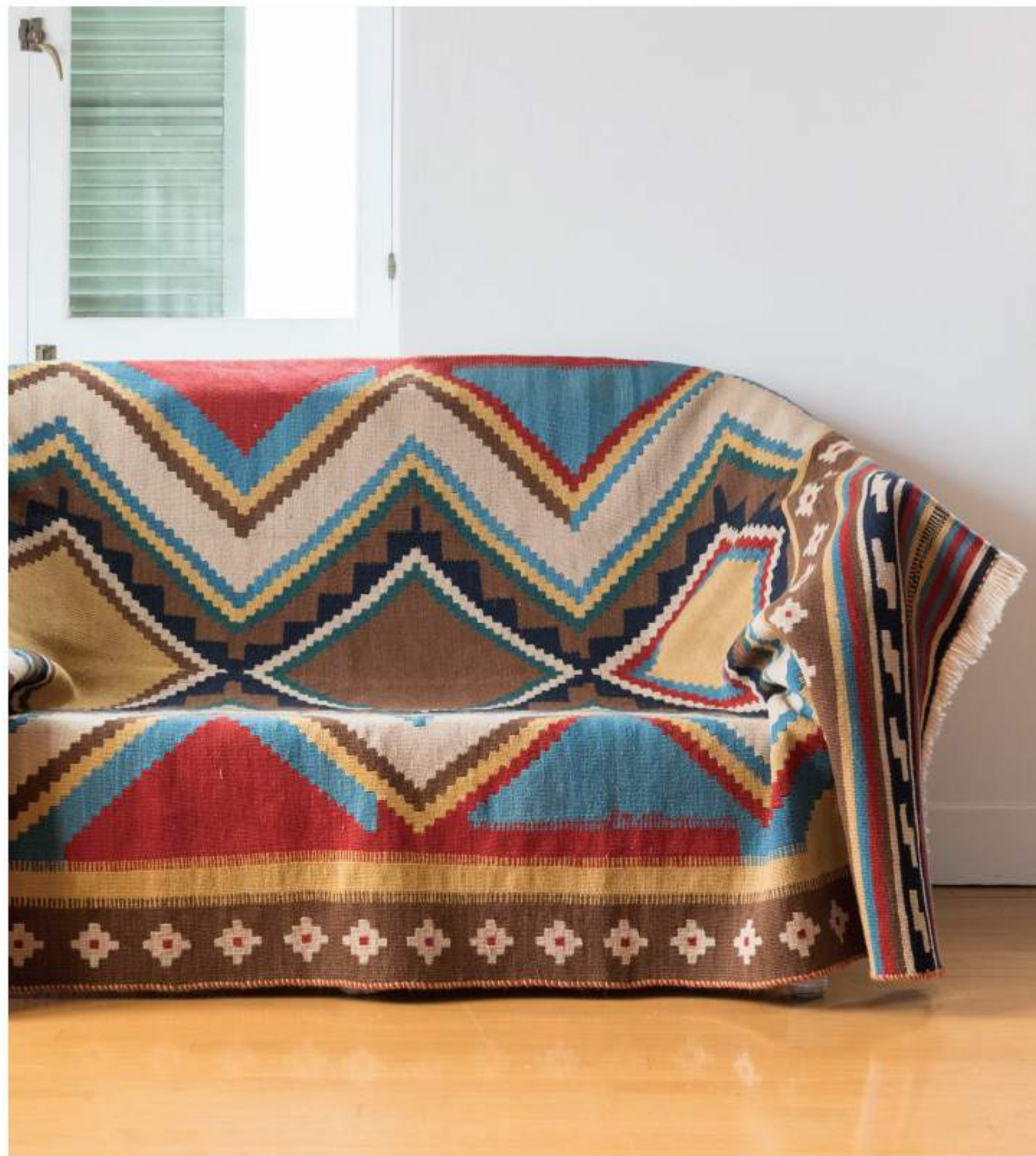
Right K.Q.5 220x152cm Qashqai Wool, Kilim