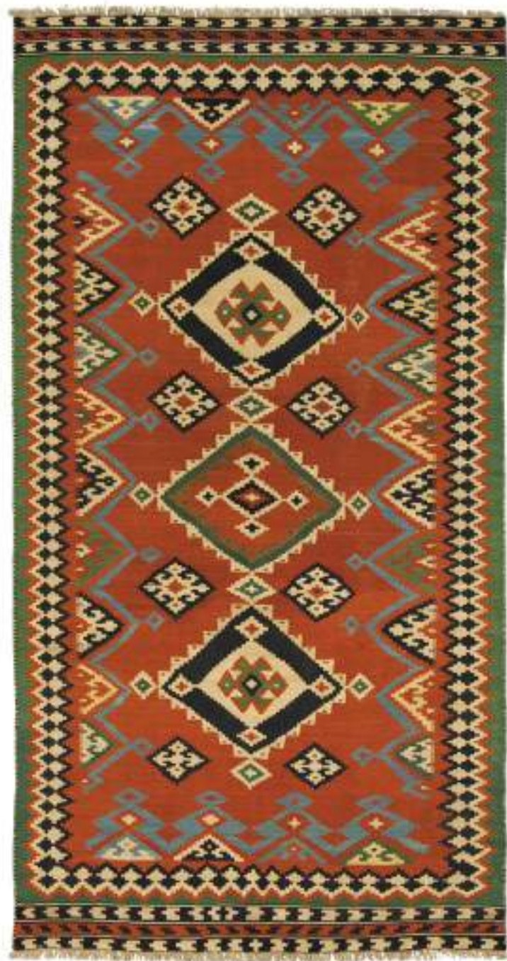
Left KQ62 248x152cm Qashqai Wool, Kilim