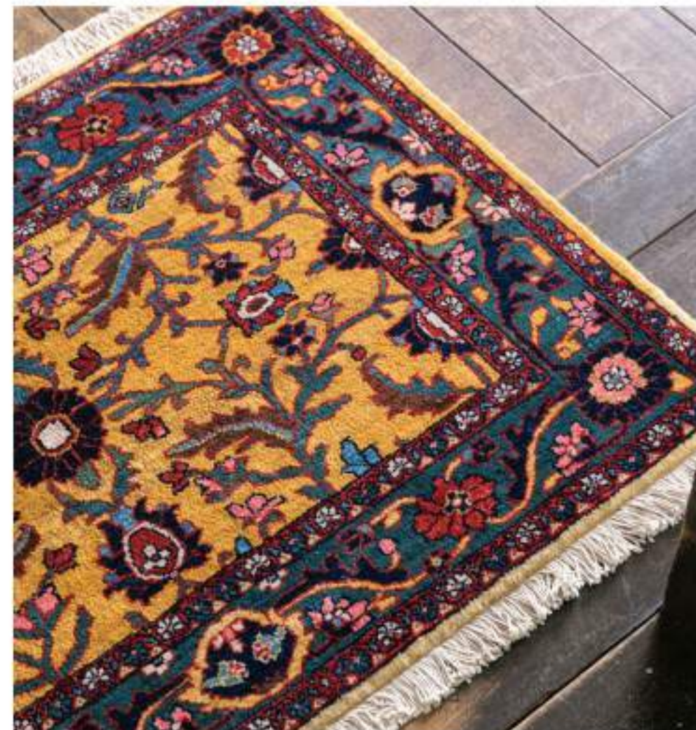
Rozha (ロザ) 69×97cm Farahan Wool