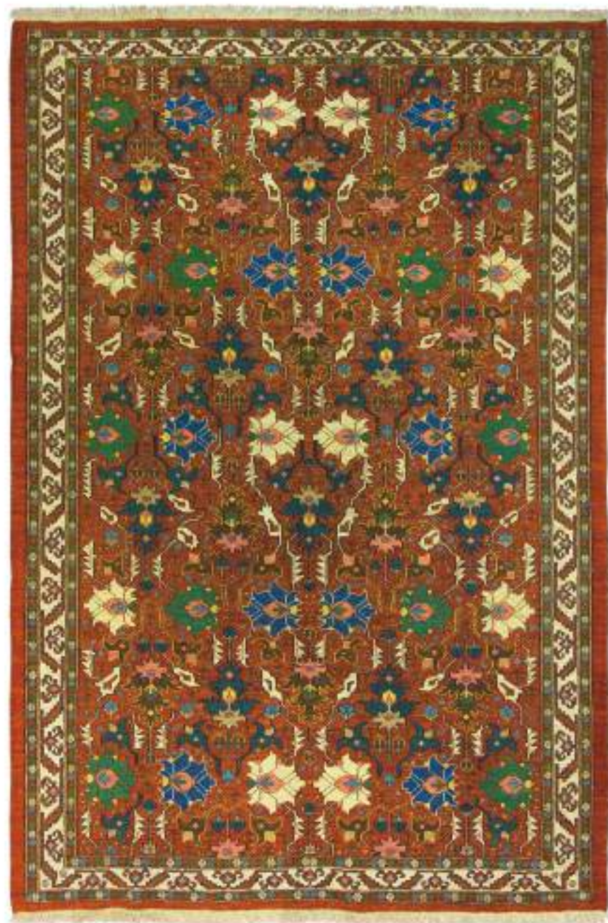
Left Aghoush (波斯) 262×162cm Shahravan Wool, Sumak