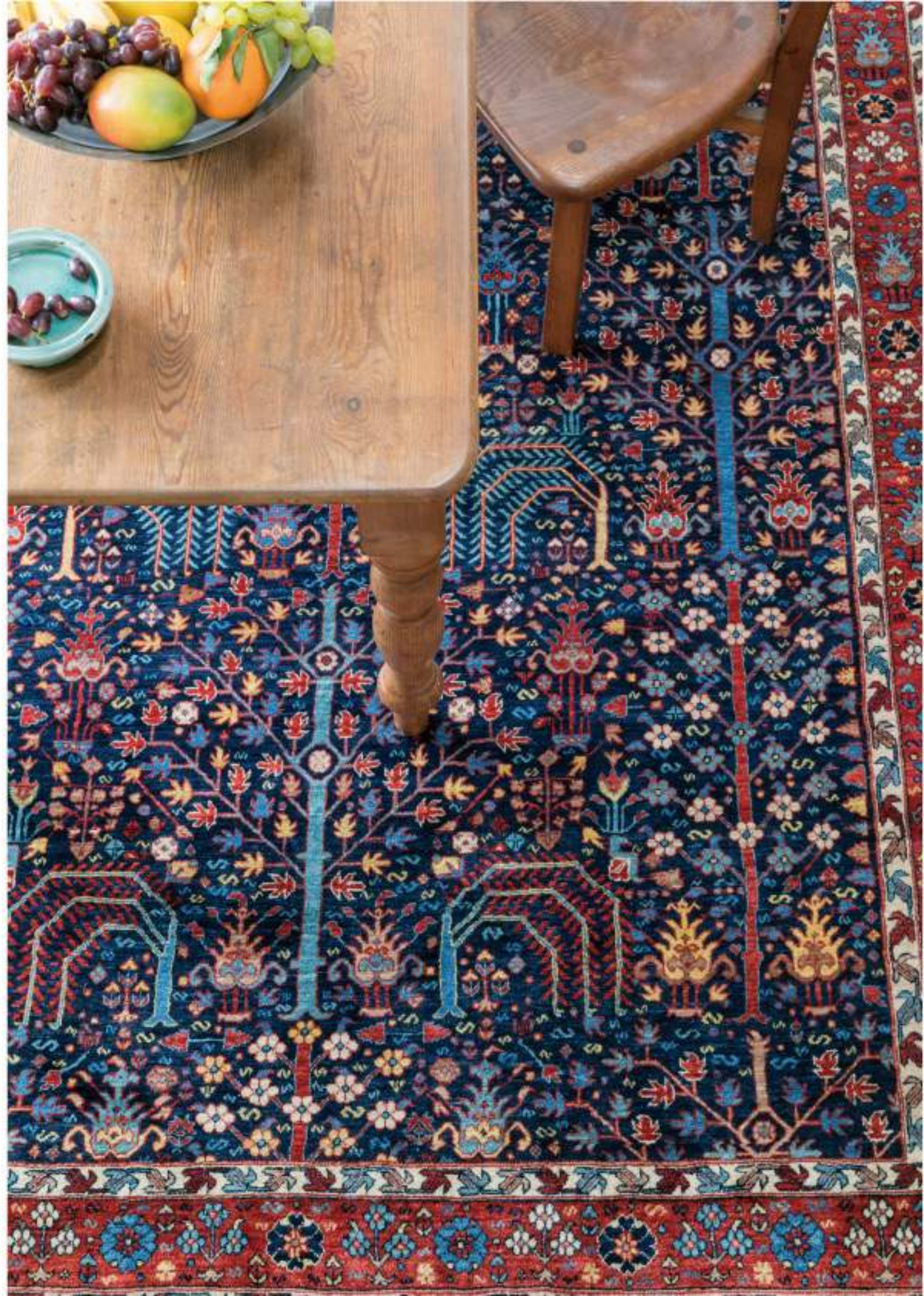
Right Jangal (生命の木) 298x200cm Garrouz Wool