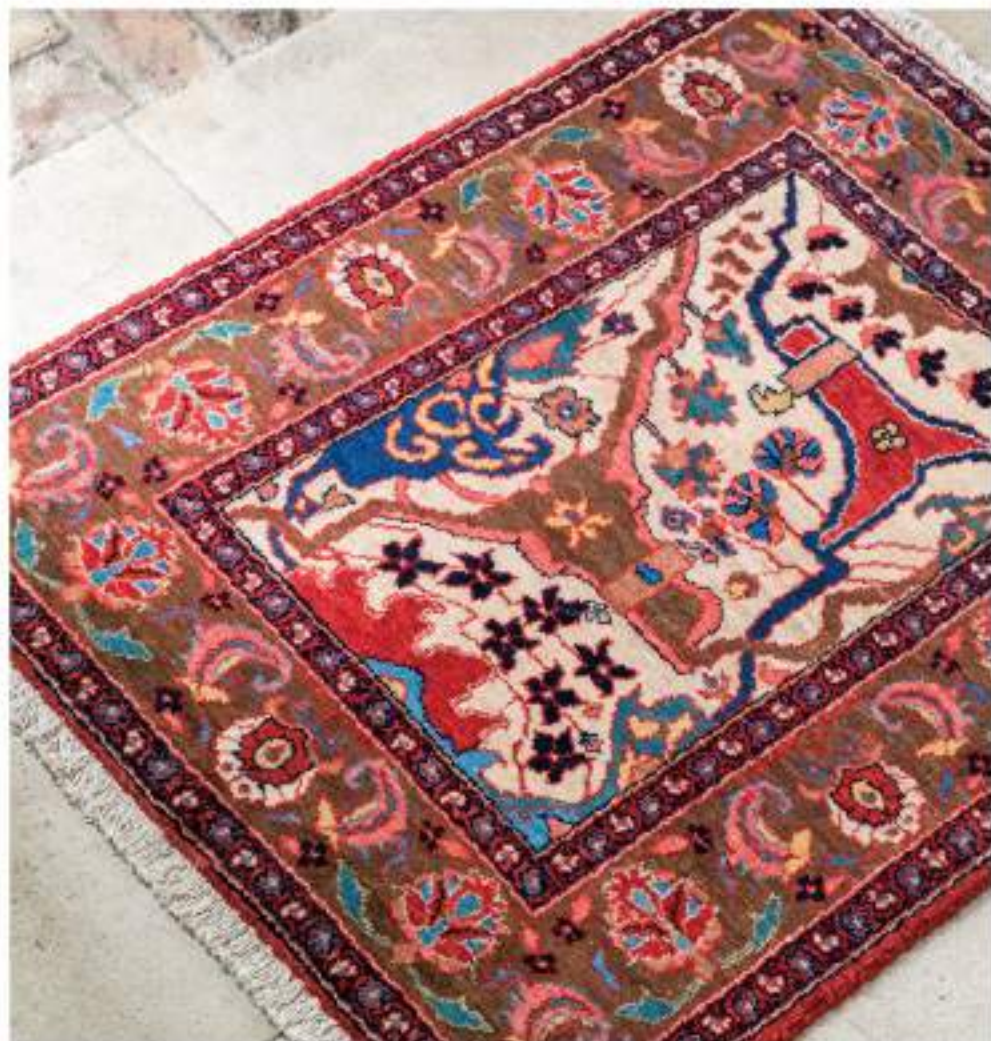
Sardar (サーダール) 98×78cm Bidjar Wool