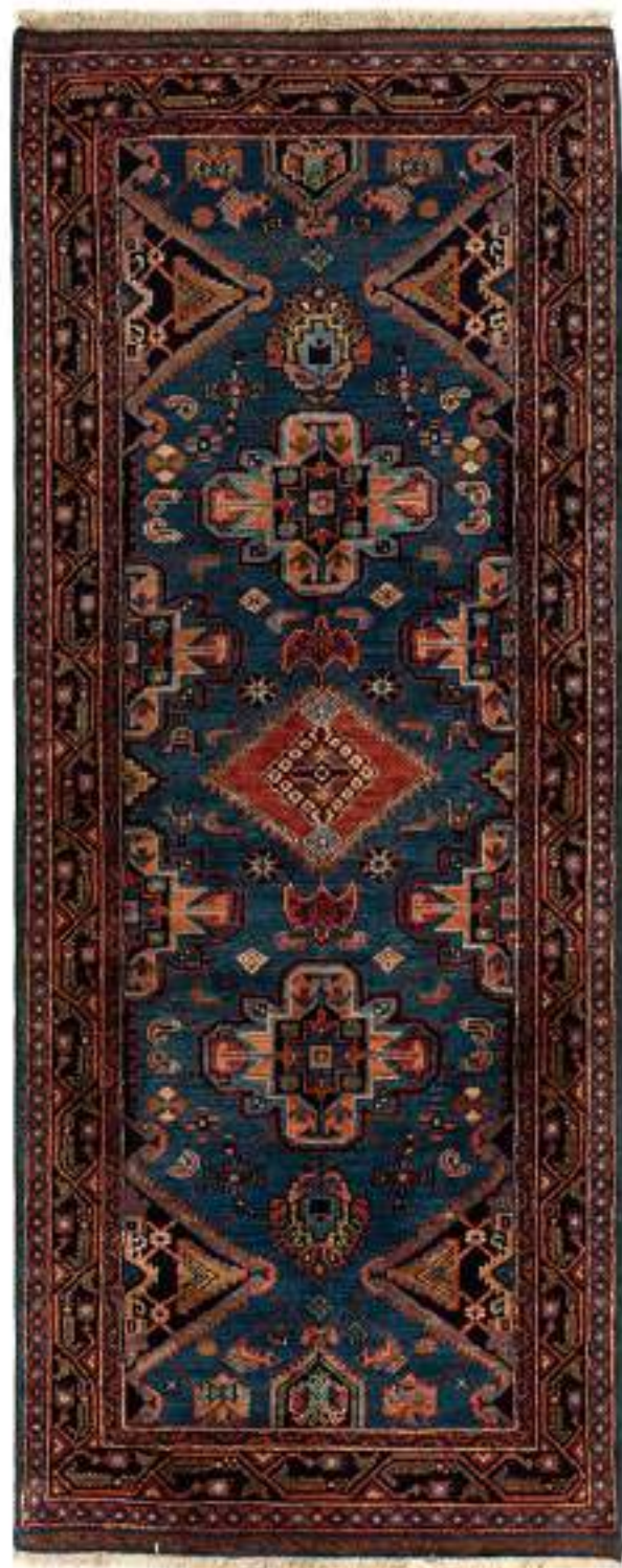
b Samin (大切な) 194x78cm Malayer Wool