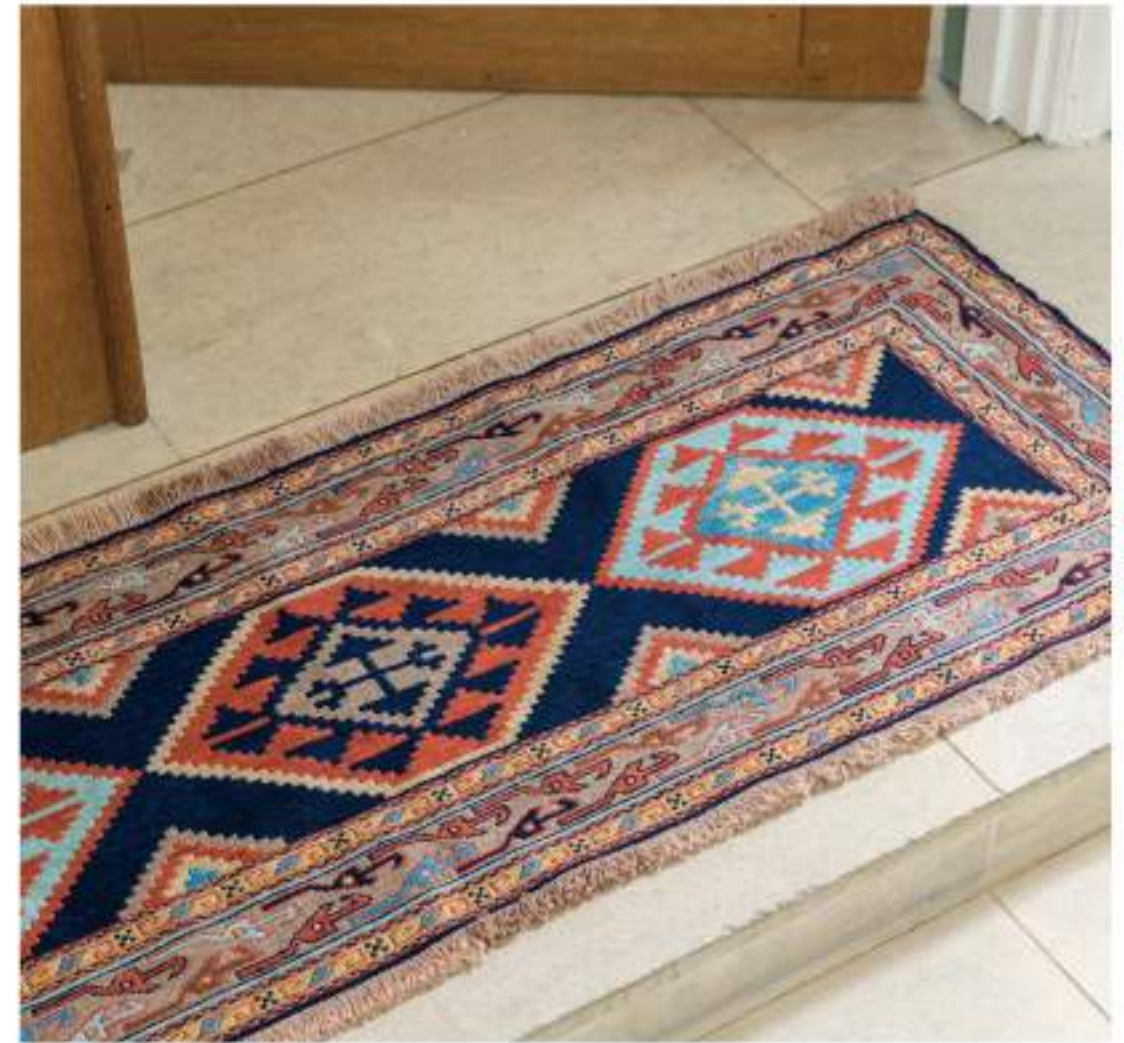
Left Alma (りんご) 182x157cm Shahsavan Wool, Sumak