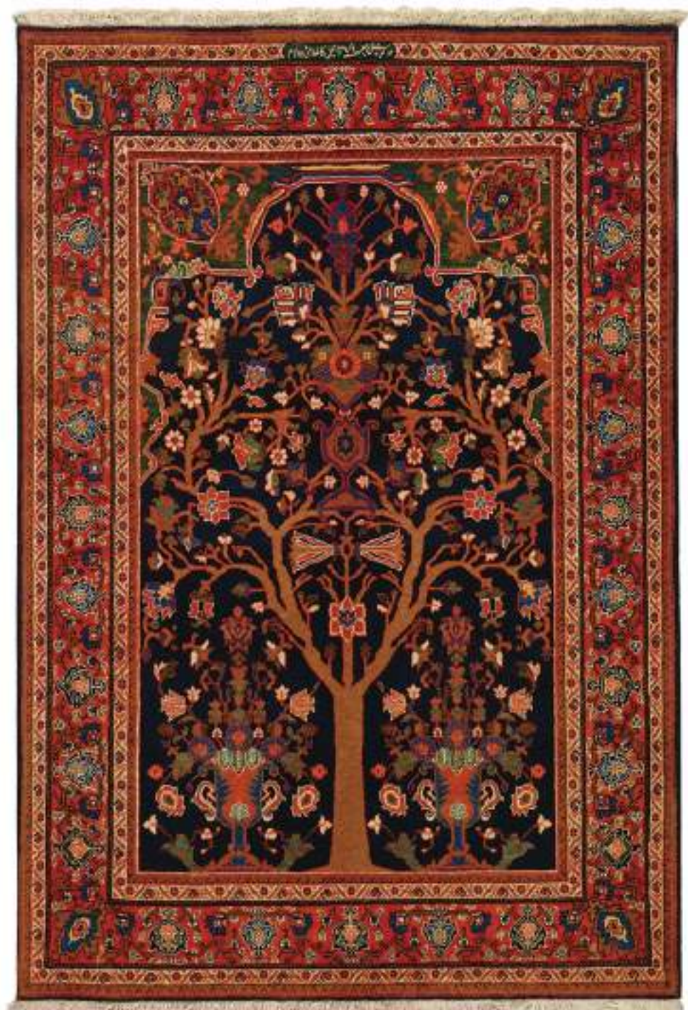
Left Derakhshe Tuba (生命の木) 166x153cm Kashan Wool