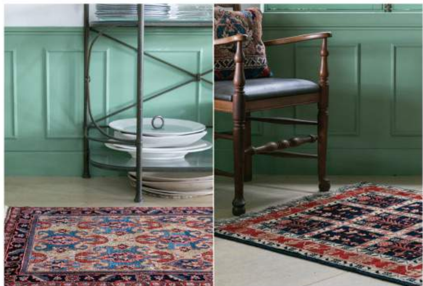
Left Sohail (原) 211x85cm Qashqai Wool