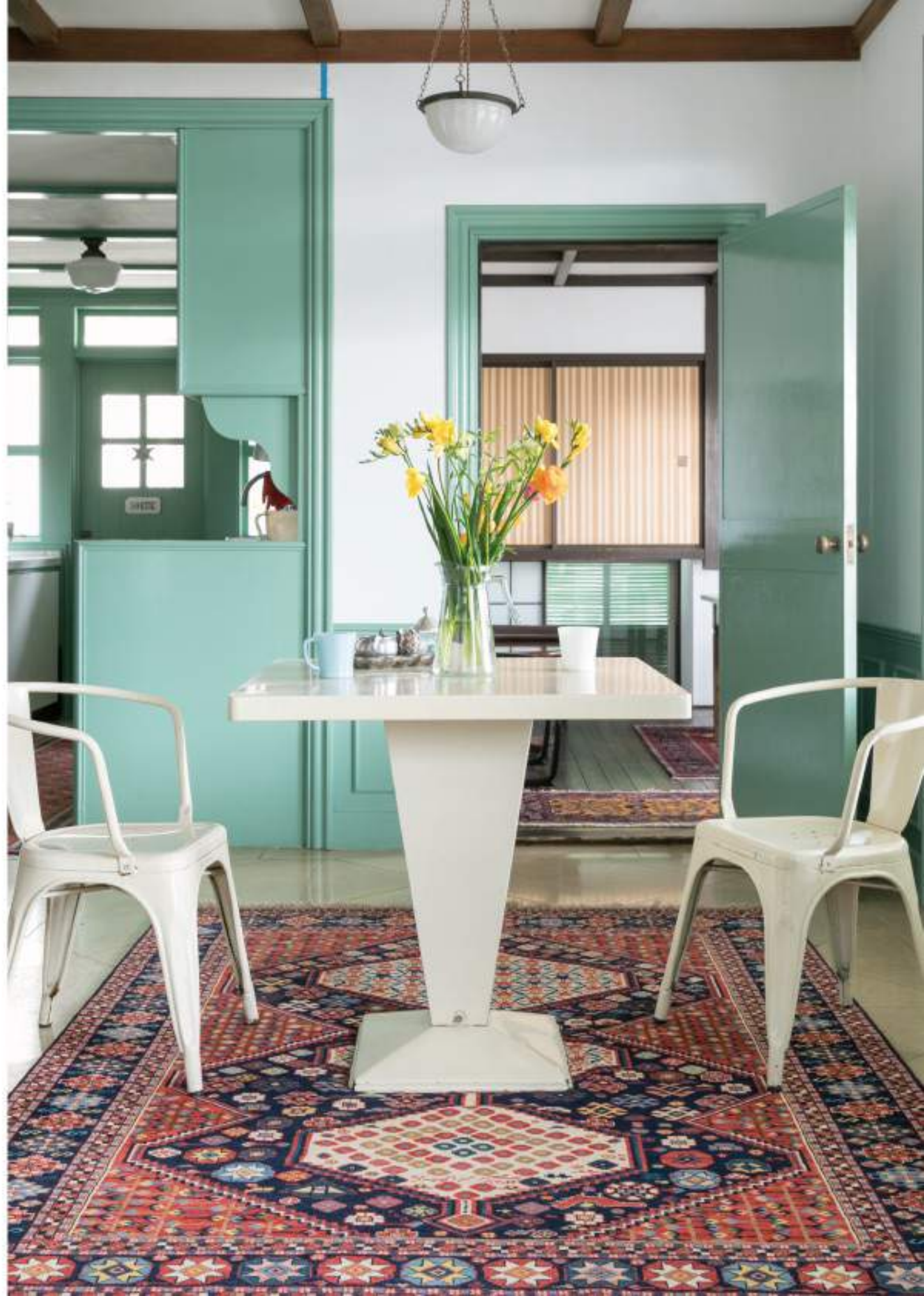
Right Radim (騎士のような) 226x167cm Qashqai Wool