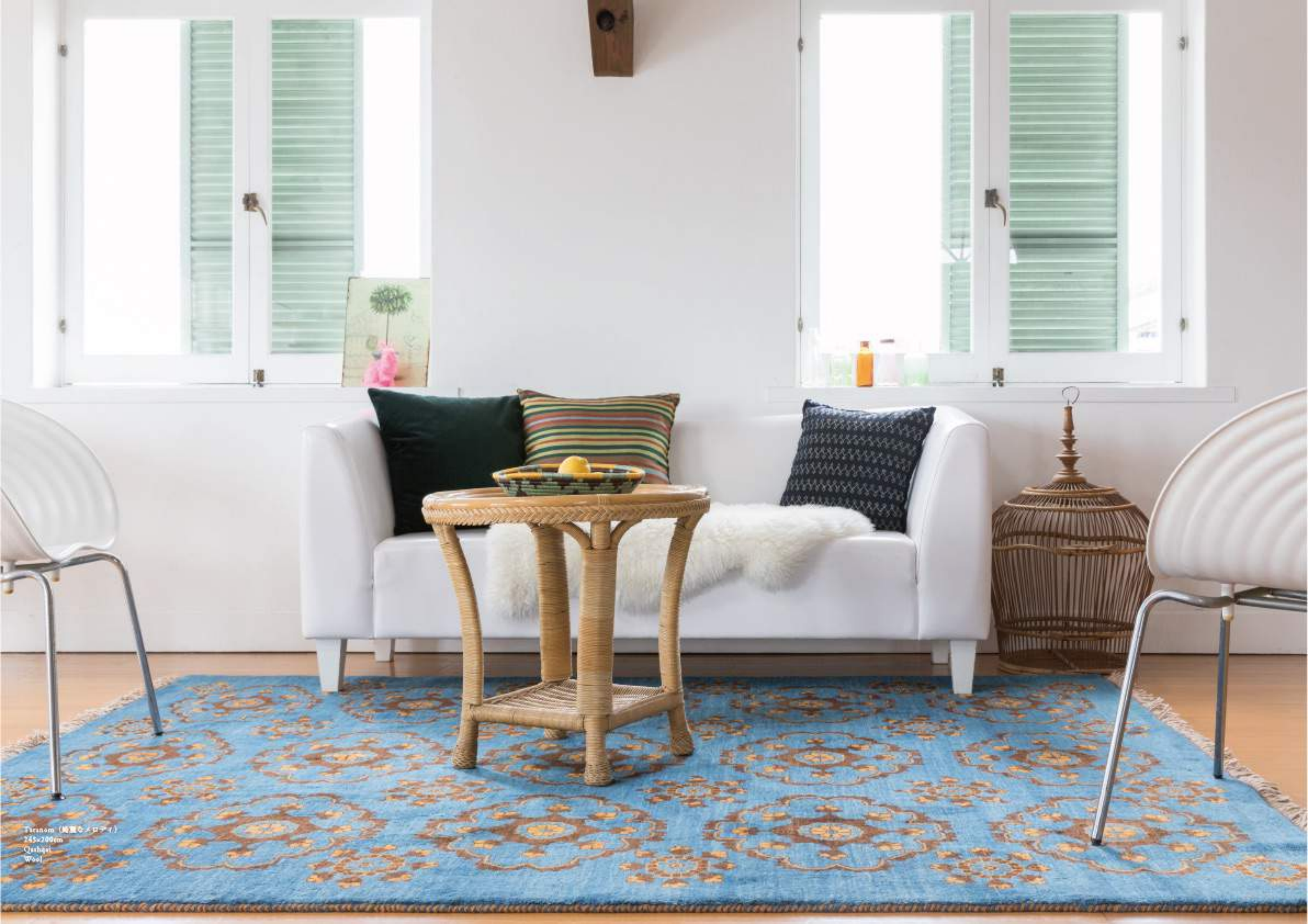
Tiranom (純羊毛メロアイ) 245×200cm Qashqai Wool