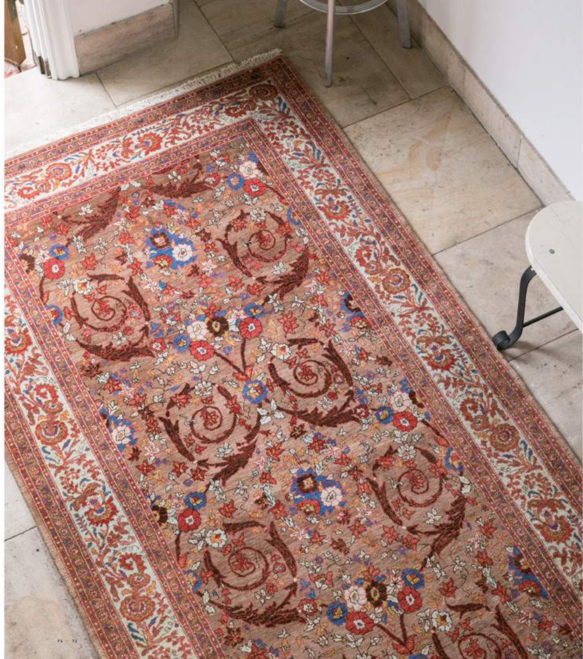
Right Gisoo (三つ薔みの女の子) 308×146cm Bidjar Wool