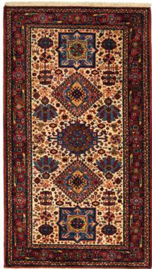
Left a Nahid (水の女神) 156x87cm Arrabaf Wool