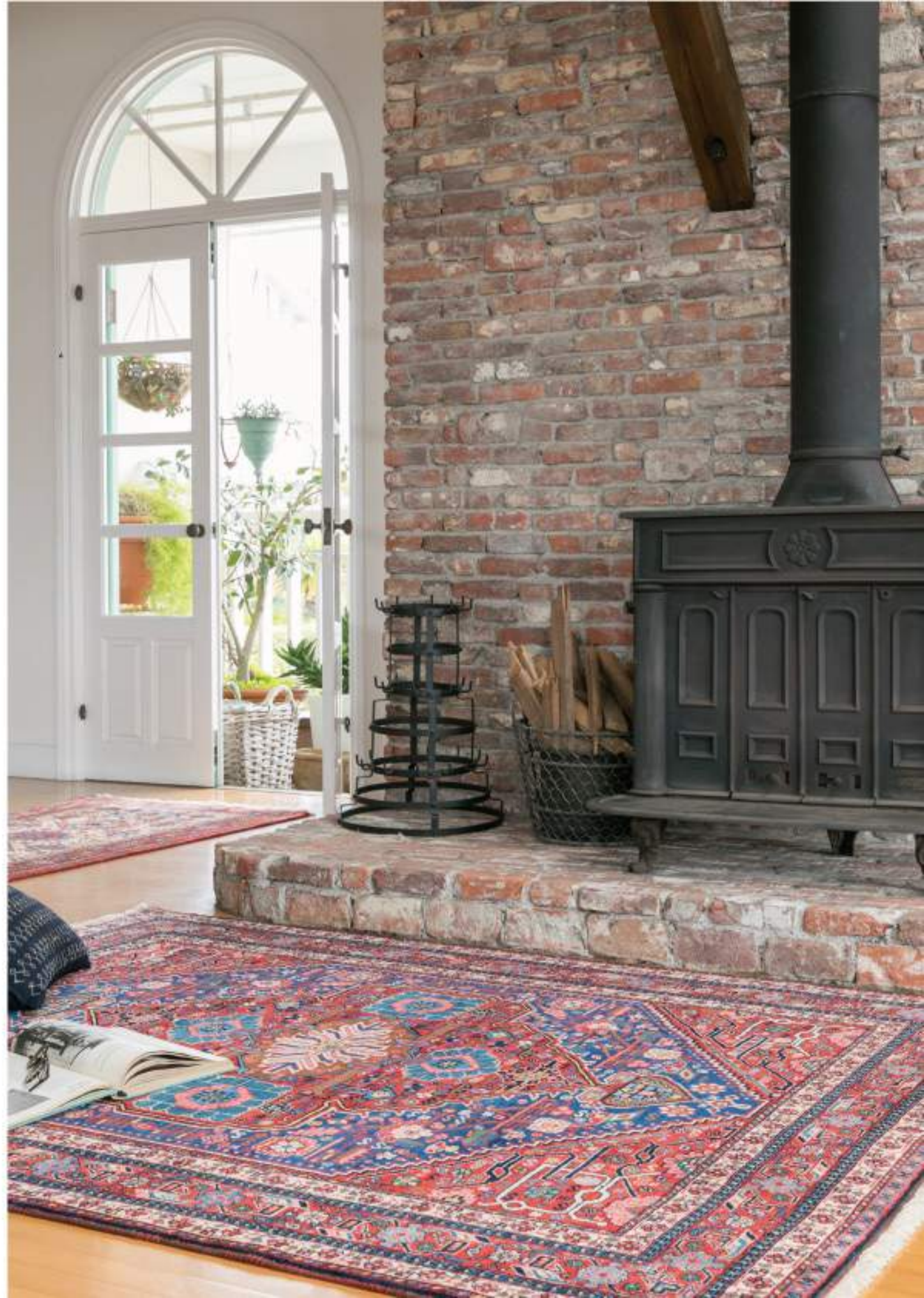
Right Mah Pari 206x168cm Arrabaf Wool