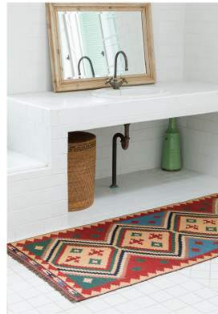
KQ1 208x88cm Qashqai Wool, Kilim