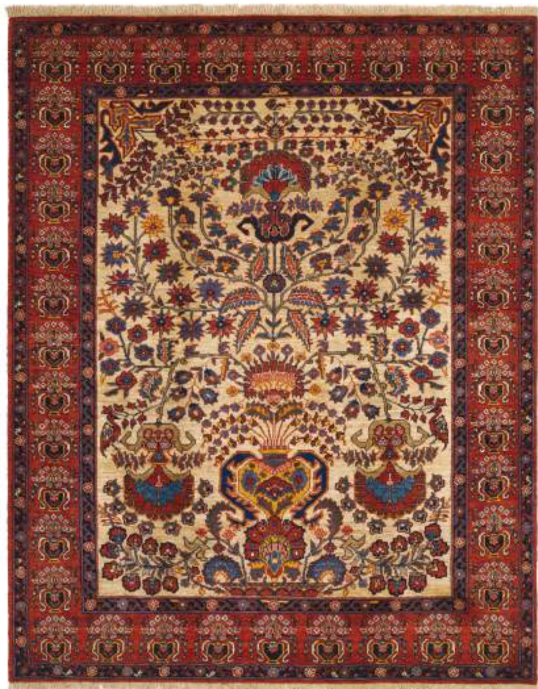
Left Goldan (花瓶) 189x151cm Farahan Wool