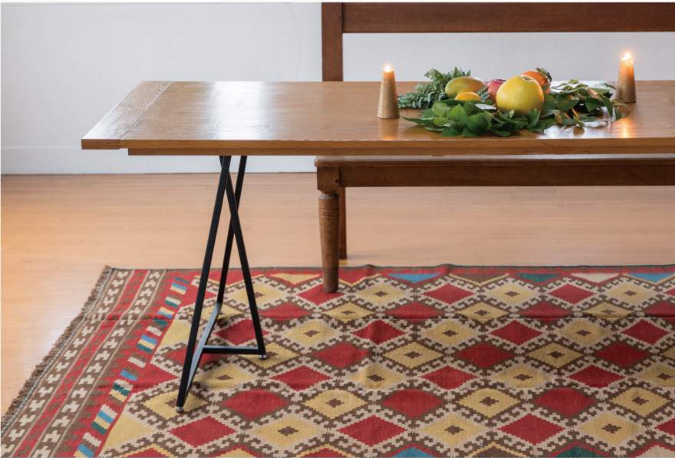
KQ4 291x161cm Qashqai Wool, Kilim