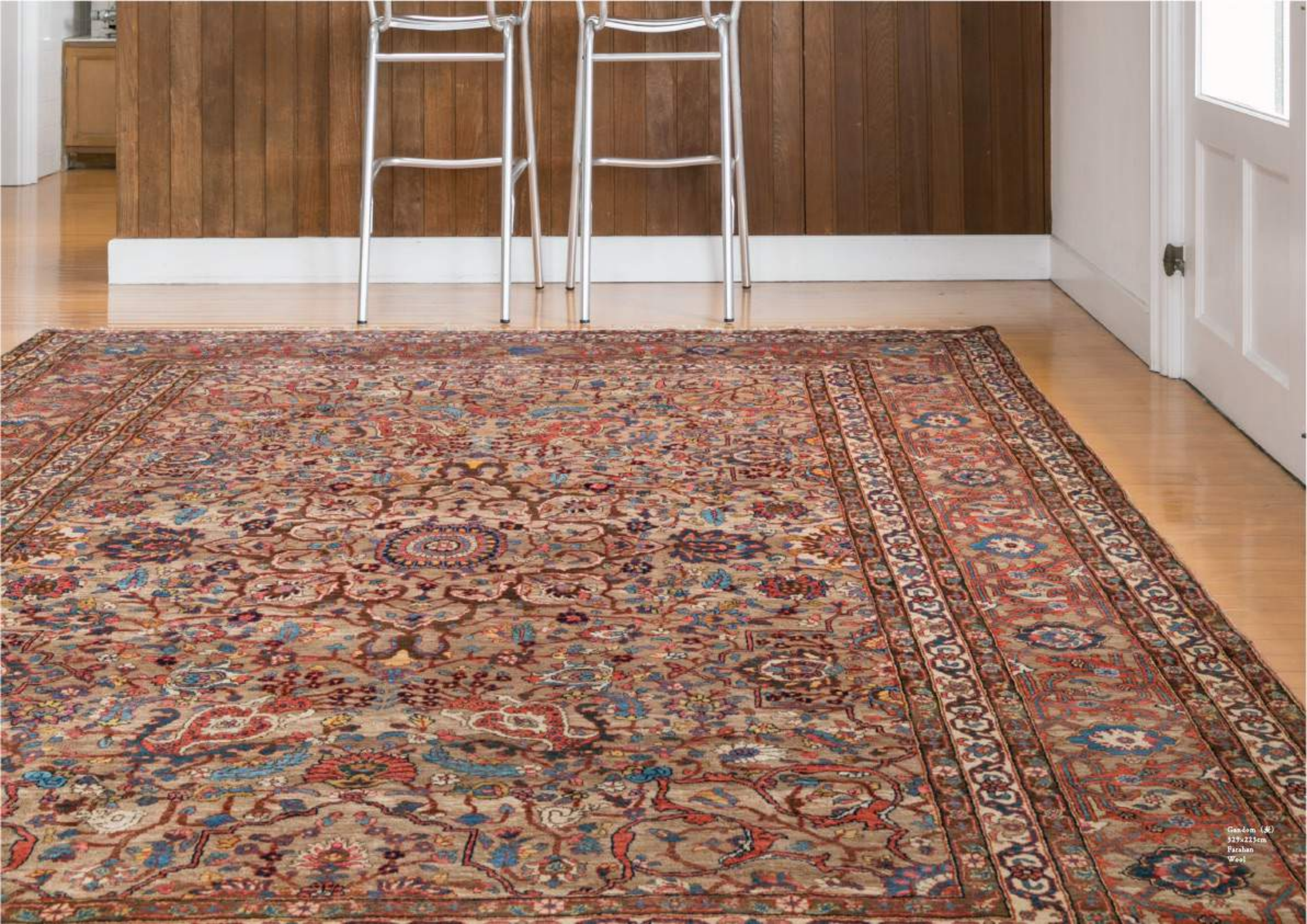
Gandom (30) 529x223cm Farahan Wool