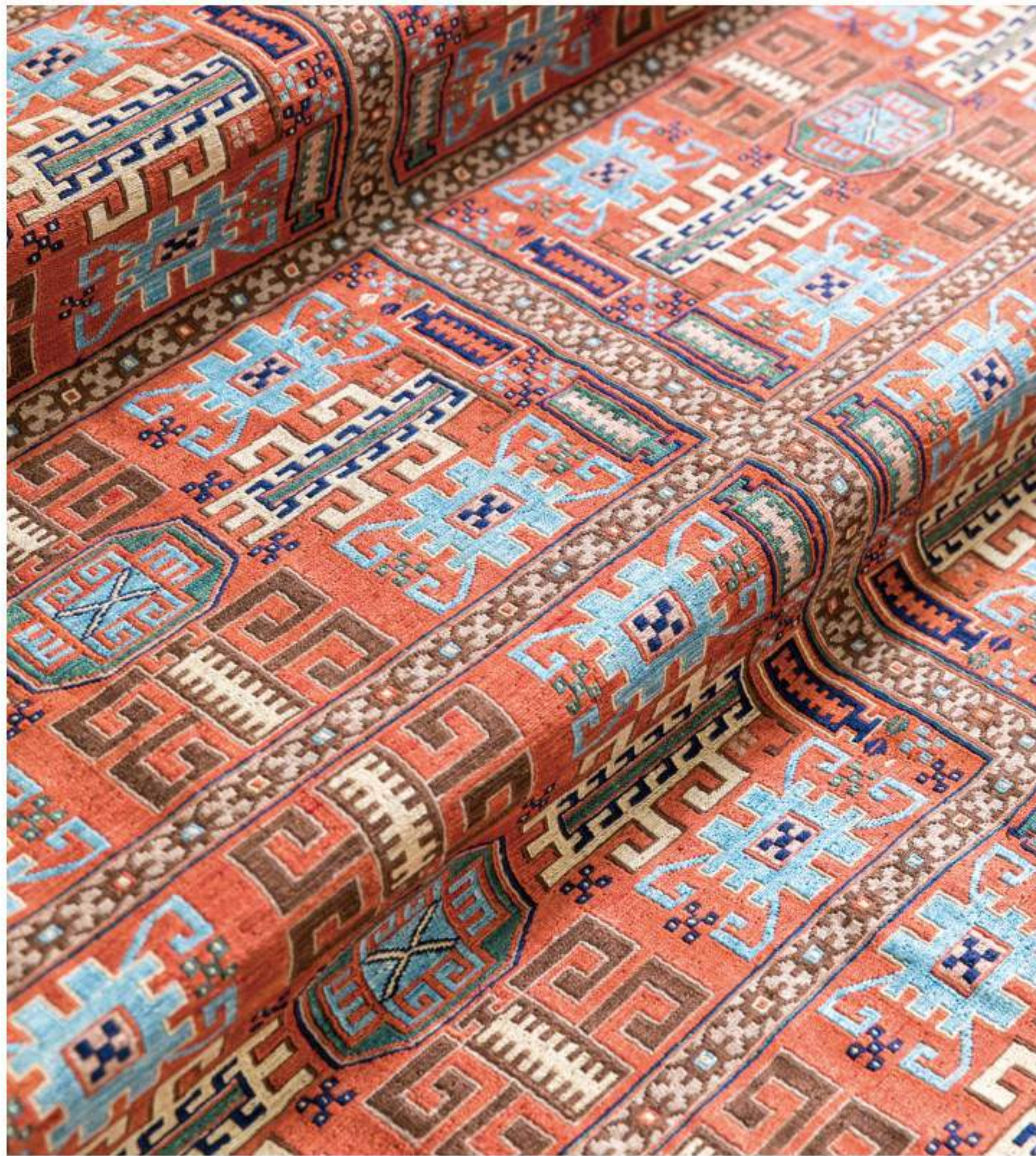
Right Dooman (波斯) 183×140cm Shahravan Silk, Sumak